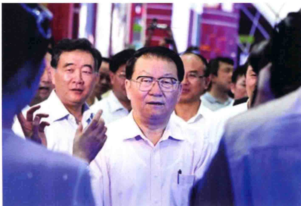
5月12日至15日，中共中央政治局常委李长春赴深圳就加快转变经济发展方式、深化文化体制改革、推进文化事业和文化产业等进行调研。