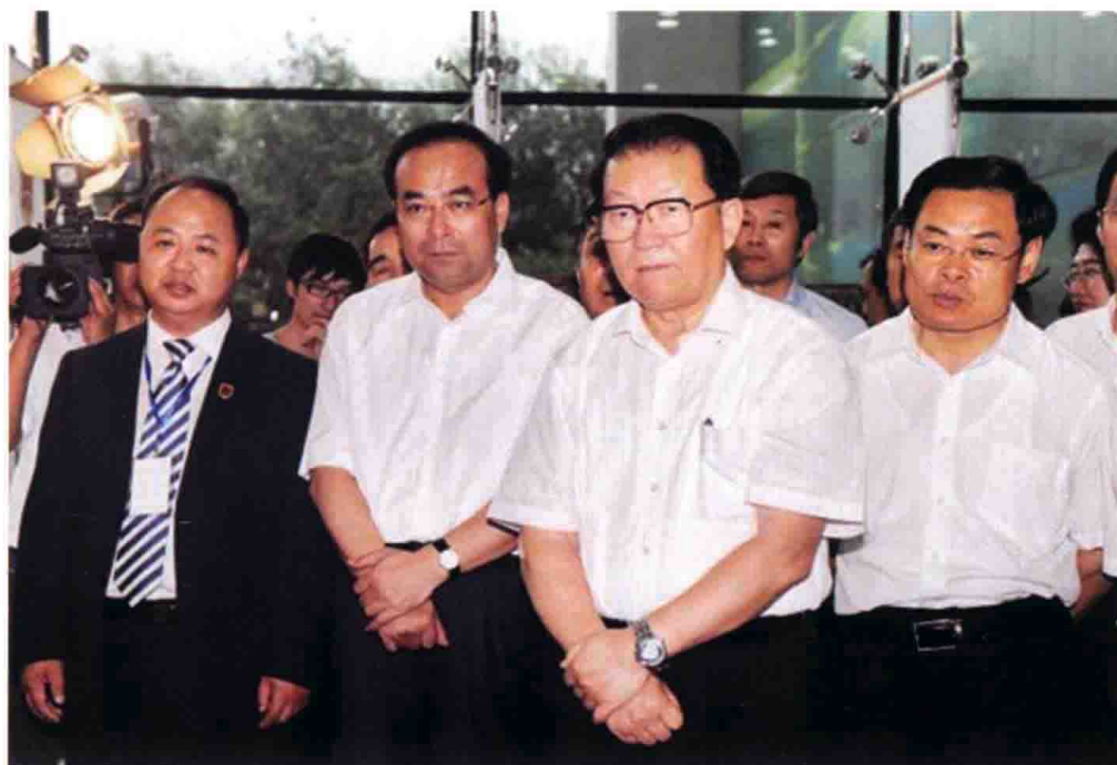
8月28日，中共中央政治局常委李长春到吉林动画学院进行视察，勉励学院努力成为在全国具有较强影响力和竞争力的动漫研发生产基地。