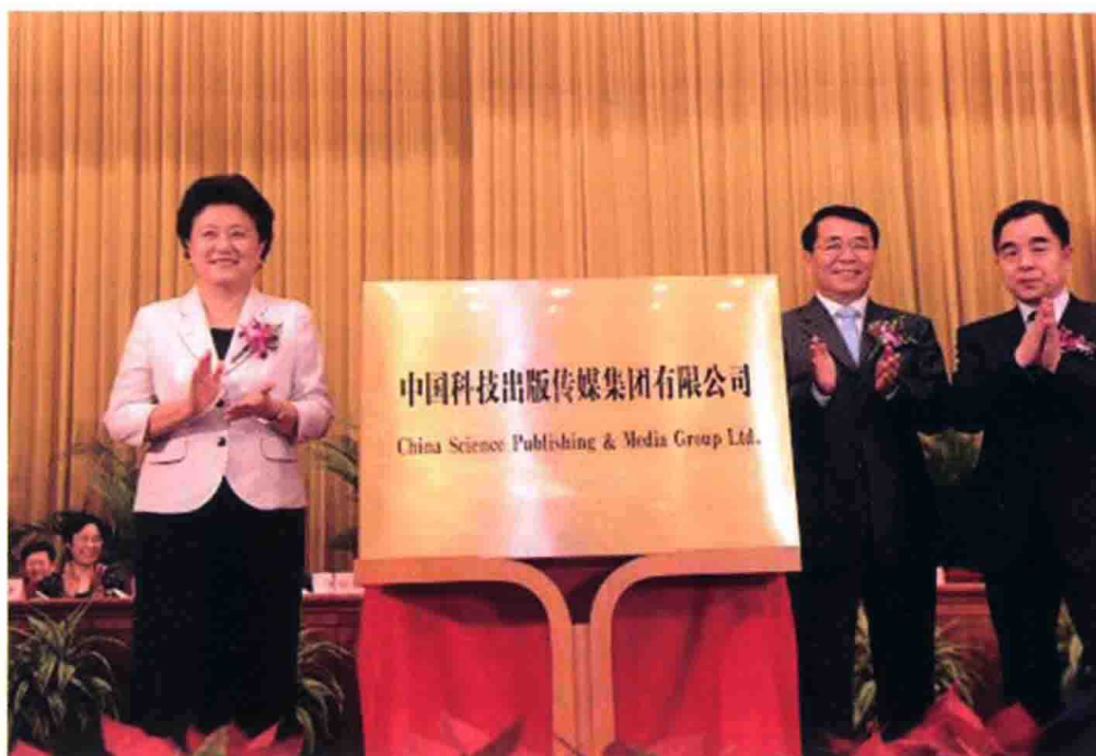
7月19日，中国科技出版传媒集团有限公司暨中国科技出版传媒股份有限公司成立大会在北京举行，中共中央政治局委员、国务委员刘延东出席并为集团揭牌。