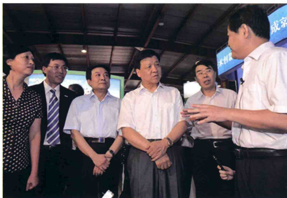
8月26日，中共中央政治局委员、中央书记处书记、中宣部部长刘云山参观第二十届北京国际广播电影电视设备展览会。