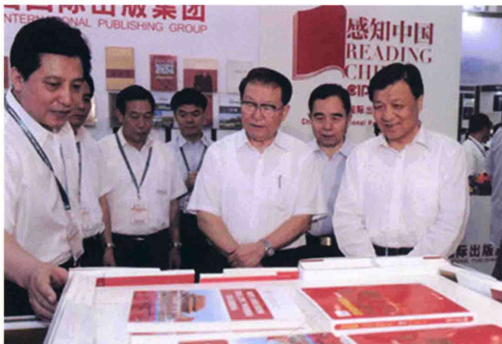
8月31日，中共中央政治局常委李长春参观第十八届北京国际图书博览会。