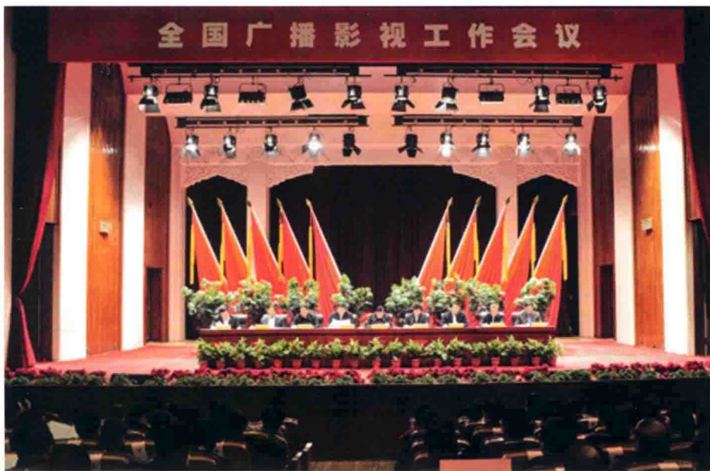
1月11日至12日，2011年全国广播影视工作会议在北京召开。

坚持以宣传为中心，紧紧围绕科学发展这一主题和加快转变经济发展方式这一主线，紧密结合国际国内形势，深入宣传中央重大决策部署和政策措施，重点做好党的十七届六中全会精神、中央经济工作会议精神的宣传，为推动社会主义文化大发展大繁荣、推动经济社会又好又快发展提供了有力舆论支持。精心组织、圆满完成庆祝中国共产党成立90周年、纪念辛亥革命100周年、纪念西藏和平解放60周年、天宫一号和神舟八号发射、深圳大运会等宣传报道任务。深入开展“走转改”活动，把话筒和镜头对准基层、对准群众，制作播出了一大批生动鲜活、感人至深的节目，新闻报道亲和力、吸引力、感染力切实增强。积极加强国际新闻报道，日本海啸、利比亚战争、泰国水灾等重大事件都有我国广播电视记者现场采访报道，及时有力地发出中国的声音。在强化新闻节目的同时，进一步办好经济、文艺、体育、生活以及少儿、农村等其他各类节目，较好满足了人民群众多样化多方面的文化需求。