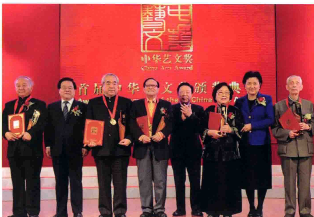
12月19日，中共中央政治局委员、国务委员刘延东出席首届中华艺文奖颁奖典礼并为获奖者颁奖。