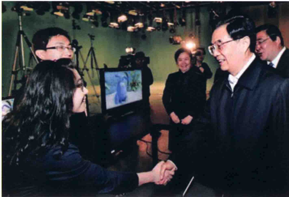
4月30日，国家主席胡锦涛考察中新天津生态城国家动漫产业综合示范园，鼓励中国动漫产业不断做大做强。