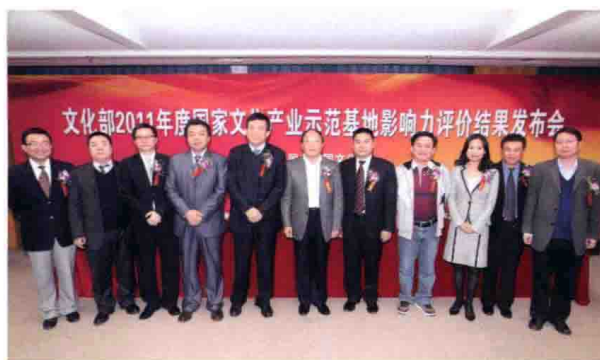
11月23日，文化部在北京举行2011国家文化产业示范基地影响力评价结果发布会。