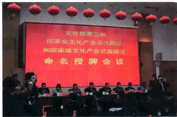
2月28日，文化部在北京举行第三批国家级文化产业示范园区和国家级文化产业试验园区命名授牌会议。