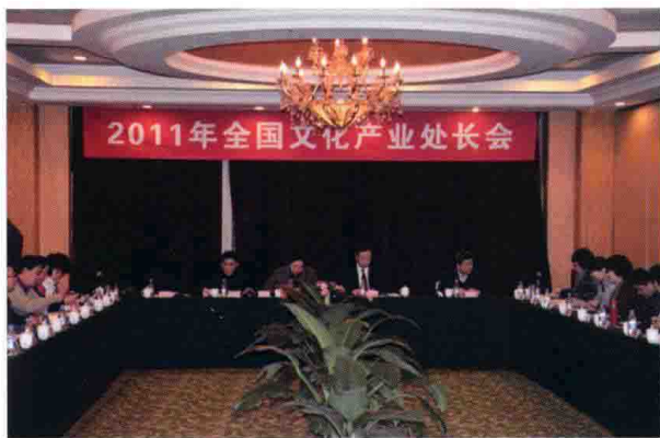
1月21日至22日，全国文化产业处长会在黑龙江哈尔滨召开。

配合财政部等部门开展“2011年度中央财政文化产业发展专项资金”的申报和评审工作。全年共为各地约140个文化产业项目提供总计约5亿元的资金扶持。在文化部的争取下，首次将文化企业的保费补贴纳入专项资金支持范围。先后组织召开金融支持文化产业工作座谈会、文化产业财政金融专项协调会，推进文化产业与金融对接。进一步深化部行合作机制，据统计，截止到2011年底，通过部行合作机制完成的重点文化企业信贷项目68个，涉及金额188.91亿元，贷款余额97.32亿元。印发《文化部、中国建设银行关于贯彻落实支持文化产业发展相关工作的通知》。下发《文化部关于推进文化