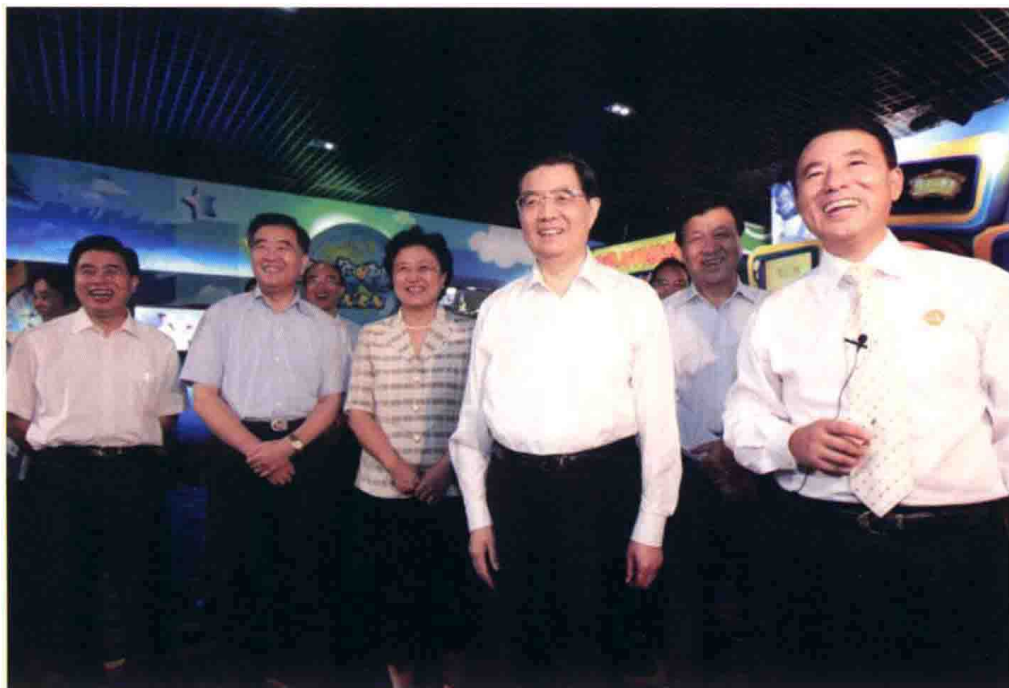
8月11日，国家主席胡锦涛考察深圳华强文化科技集团股份有限公司。