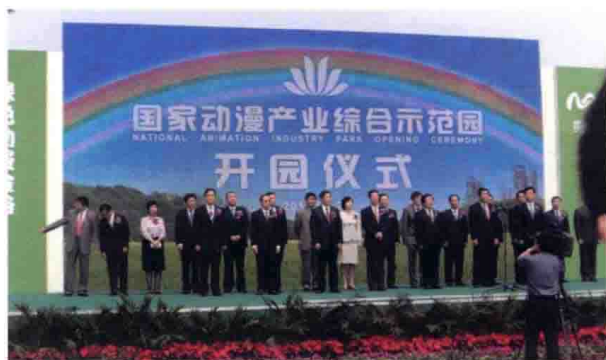
5月27日，由文化部与天津市政府共同建设的国家级重大文化产业项目——国家动漫产业综合示范园正式开园。

文化部联合相关部委成功举办了第七届中国（深圳）国际文化产业博览交易会、2011中国义乌文化产品交易博览会、第六届中国北京国际文化创意产业博览会、第四届中国东北文化产业博览交易会、第七届中国国际动漫游戏博览会和第29届中国洛阳牡丹文化节等博览会和节庆活动，有效促进了文化产业的交易与合作。本届深圳文博会总成交额突破1200亿元；义乌文博会实现档次、成交额、影响力三提升；第六届北京文博会共签署各类协议总金额786.85亿元人民币，比上届增长65%。中国洛阳牡丹文化节在由文化部首次参与主办后，文化内涵更加丰富，打造特色品牌的潜力进一步增强。实施“中国原创动漫推广计划”，成功组织原创动漫进新疆活动，成为文化援疆工作的一大亮点。举办了“中日动漫节”，分别在东京、北京两地举办了开幕式、论坛等活动，得到了两国高层的高度重视，成为两国动漫产业交流的高端平台。