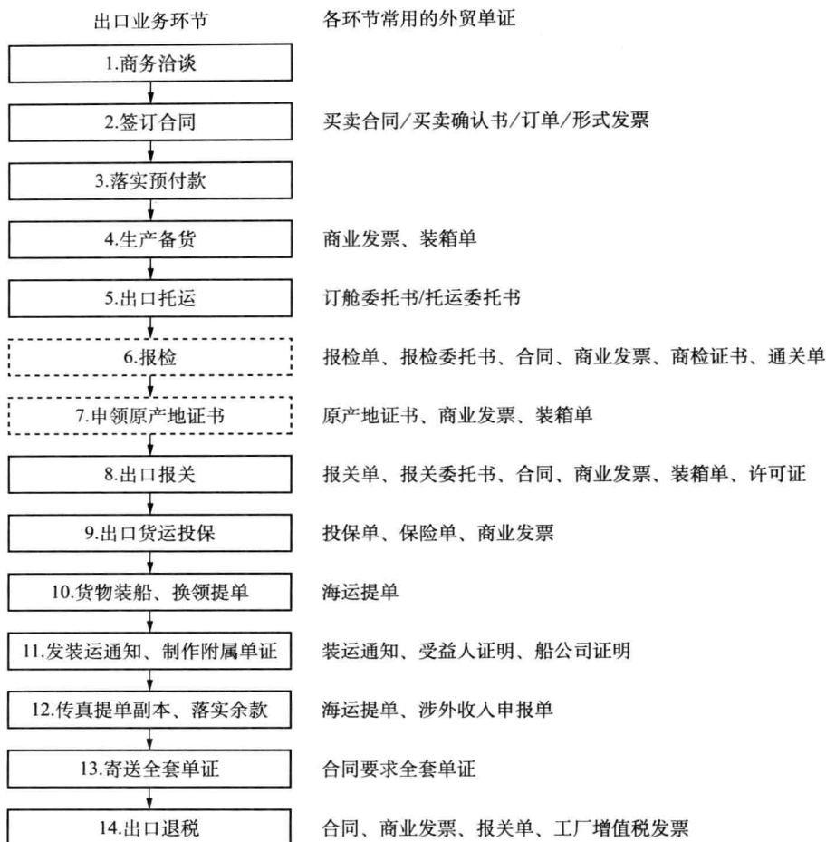
图 1-2 以一般贸易、CIF、海洋运输、电汇等条件为基础的出口业务单证流转程序