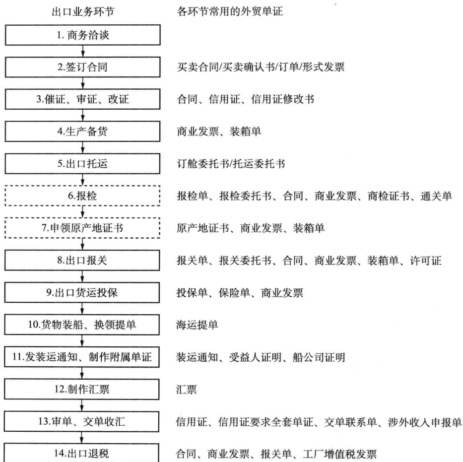
图 1-1 以一般贸易、CIF、海洋运输、信用证等条件为基础的出口业务单证流转程序

以一般贸易、CIF、海洋运输、信用证等为主要交易条件的出口业务中,所涉及的外贸单证及其流转程序如图 1-1 所示。