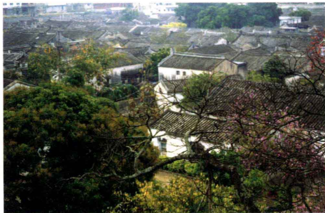
我的母校揭阳新华中学一角

兴冲冲来到武汉读书，懵懵懂懂上了半年课后，我才发现所学专业 and 兴趣相去甚远，而“一考定终生”的现实又逼得我硬着头皮读下去，心境自然十分压抑；这时，家乡的风物，便趁机慢