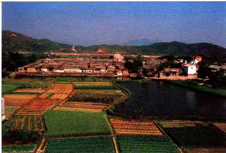
潮汕民居保留着汉唐世家聚族而居的传统，村寨规模十分巨大。