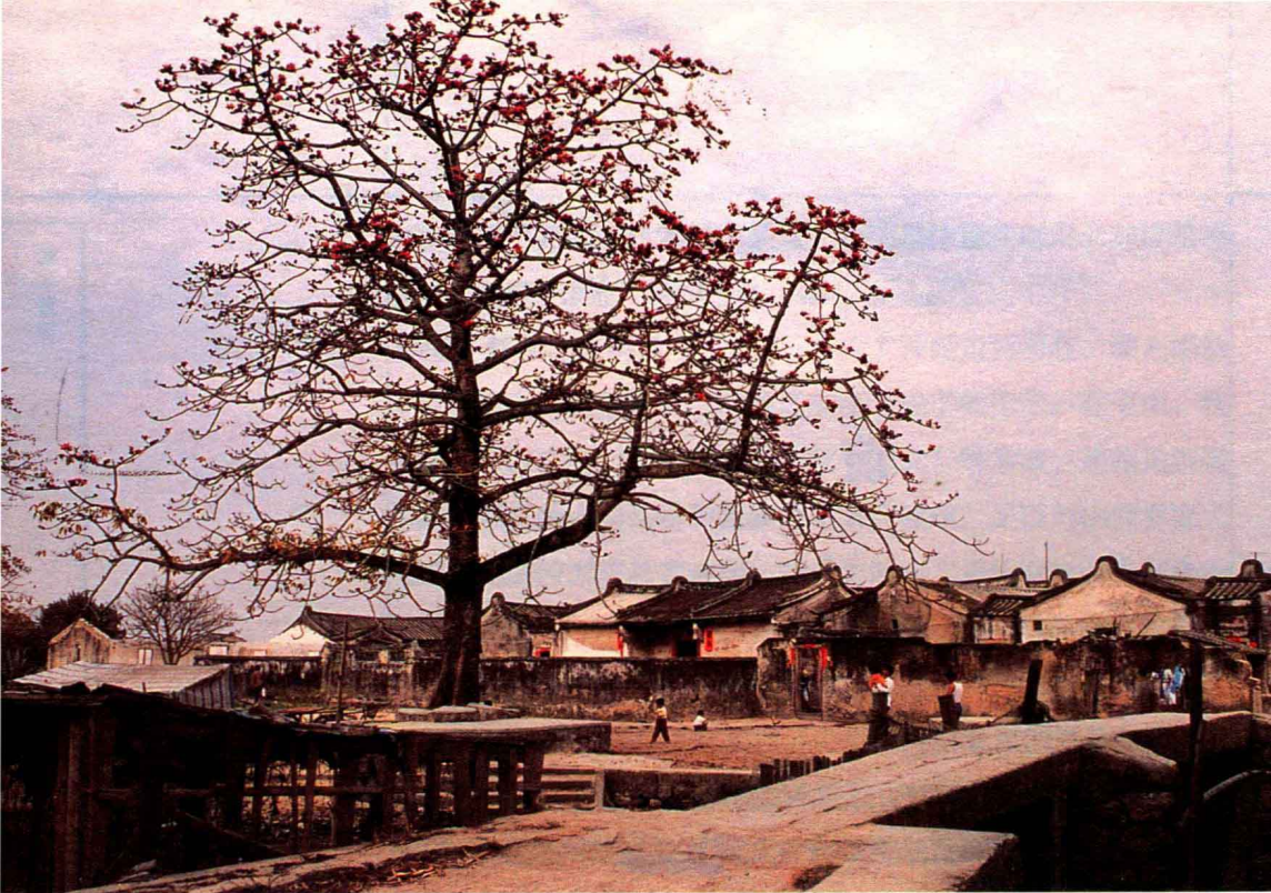
潮汕村庄里有一围一围的老厝

在这些“老厝”里读了整整十年书之后，我考上了武汉科技大学材料系，于是，和离开祖地的先人一样，用红纸包起一抔乡土，扛着行李第一次离开了家乡。