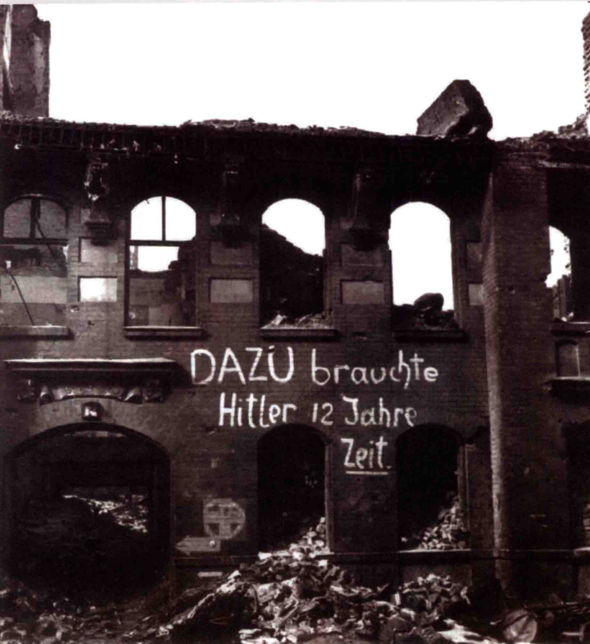
1945年，矗立在德国某城市废墟中的一幢被炸毁的房子。墙上标语是：“希特勒用12年换来了这个结果。”