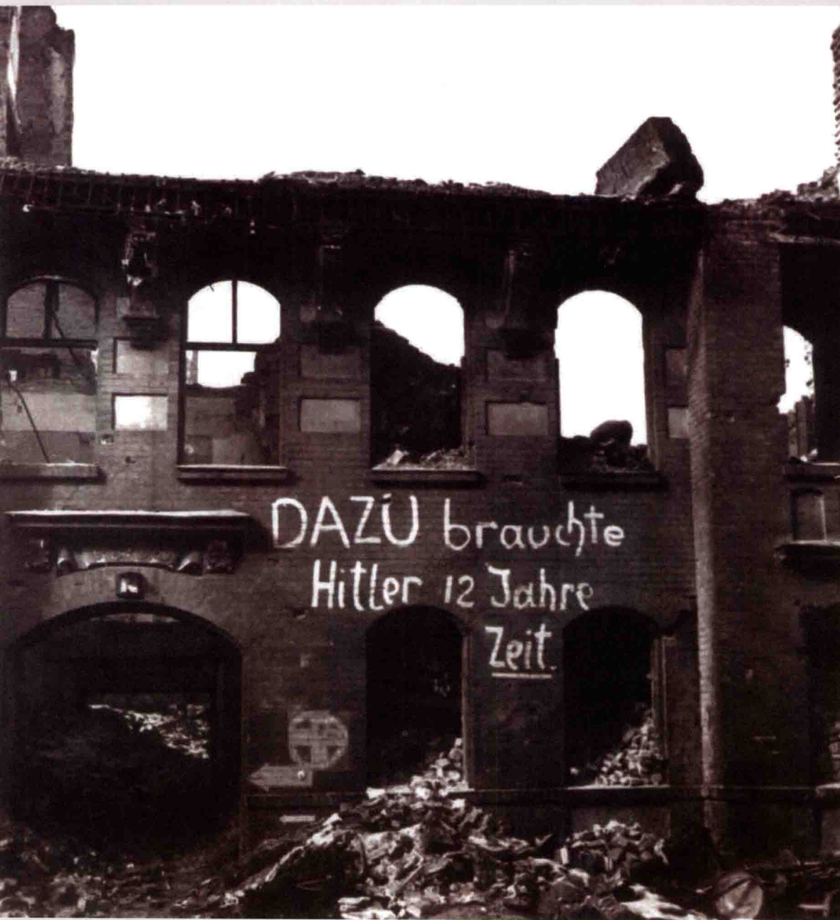
1945年，矗立在德国某城市废墟中的一幢被炸毁的房子。墙上标语是：“希特勒用12年换来了这个结果。”