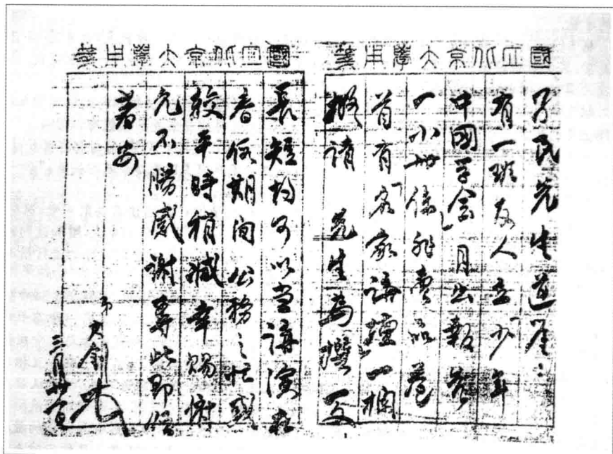
一九一九年三月为《少年中国》约稿致蔡元培函手迹