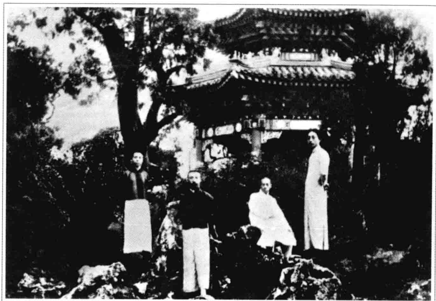
五四时期李大钊（左二）与友人在中央公园留影（左一为雷国能、右一为张申府、右二为梁漱溟）