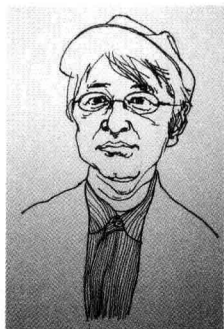
绫辻行人 Ayatsuji Yukito (1960 - )