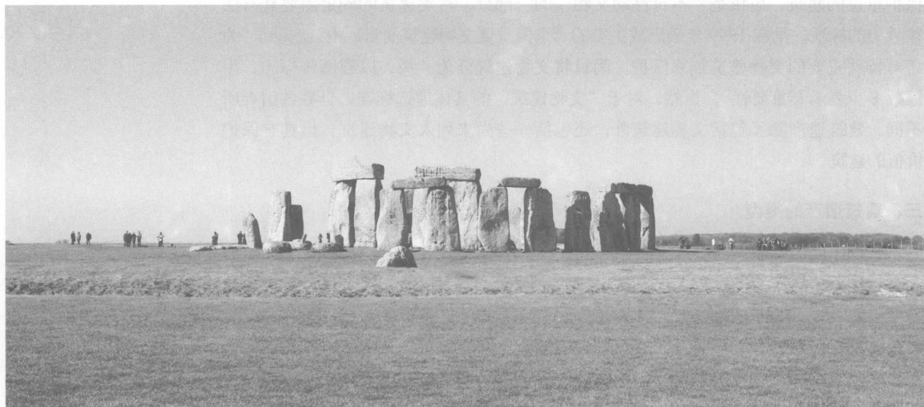
图 1-1 点状建筑遗产:英国巨石阵

根据建筑遗产的存在形态,可以分为点状建筑遗产、组群建筑遗产、面状建筑遗产、聚落建筑遗产、线状建筑群等。点状建筑遗产是以点状的空间形态存在,包括单个的建筑(构筑物)、单个的院落或为数不多的几个院落,如应县木塔;组群建筑遗产是由多个单体建筑通过一定的形式(多以庭院的形式)构成的建筑群,是中国古代建筑的基本存在状态,如故宫、颐和园;面状建筑遗产是以面状的空间形态存在,包括历史街区、大型遗址以及城市或村镇;线状建筑遗产是以线状纽带联系而形成的建筑遗产,这一现状纽带可以是具体的、物质性的,如一条道路,一条运河,京杭大运河、长城、丝绸之路等都是非常典型的线状建筑遗产。