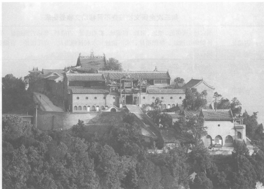
图 1-3 组群建筑遗产:山西蒲县东岳庙