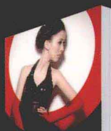
模特摆姿密码手册