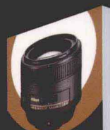
尼康数码单反镜头摆姿手册