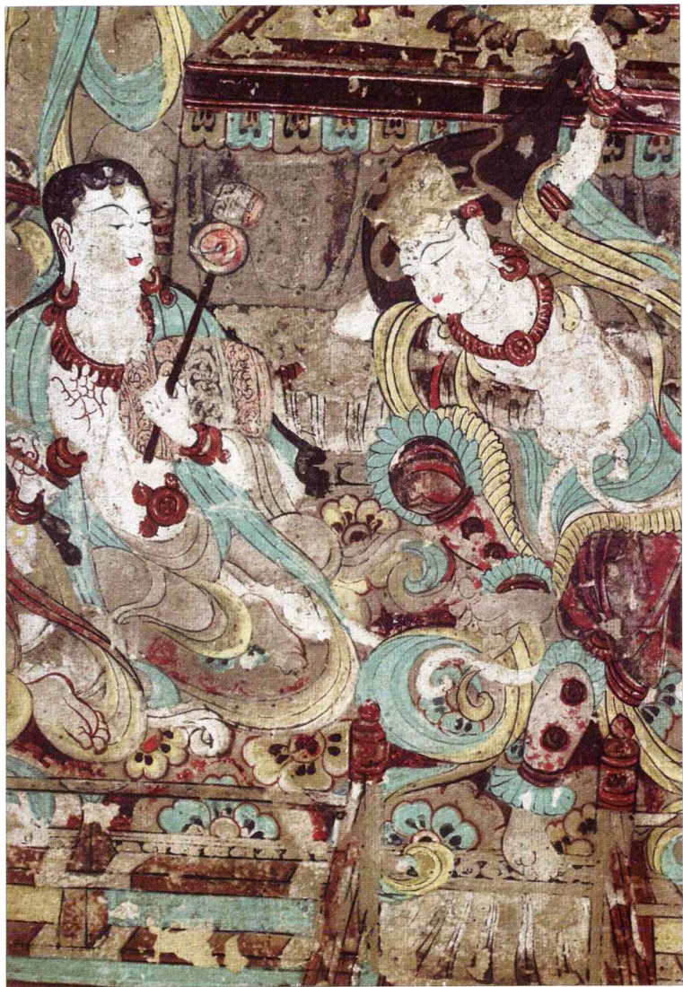
反弹琵琶伎乐天（局部）