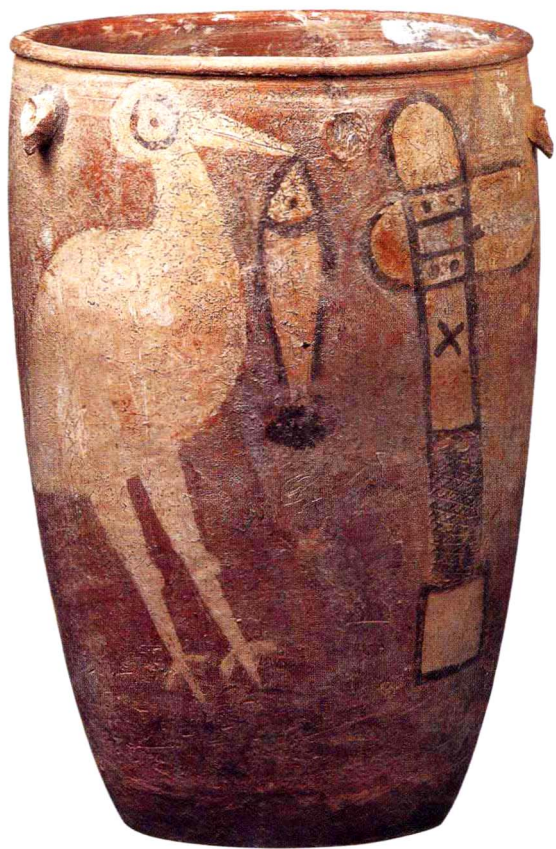
鹤鱼石斧图（陶缸彩绘）