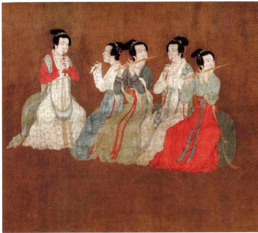
韩熙载夜宴图（局部）