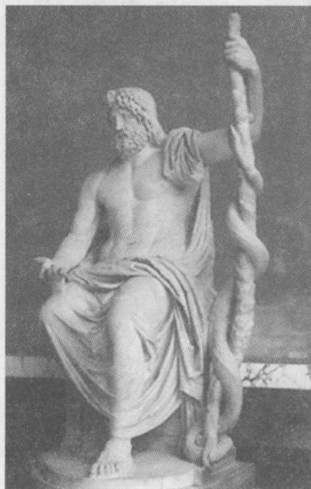
医神爱斯库拉皮厄斯的雕像

symbols of Asclepius were snakes twined round a staff, together with pine-cones, crowns of laurel and sometimes a nanny-goat or a dog. ( Dictionary of Classical Mythology : 63)