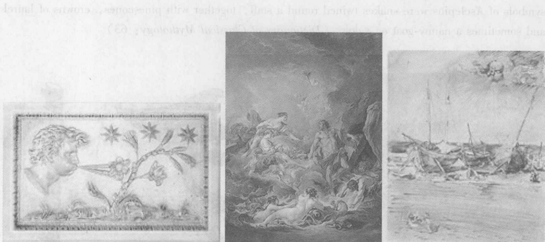
在各种传说中埃俄罗斯的形象