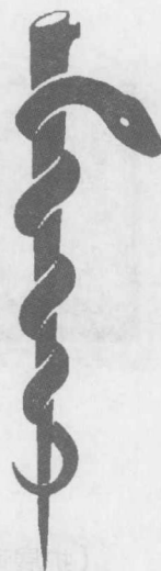
Rod of Asclepius