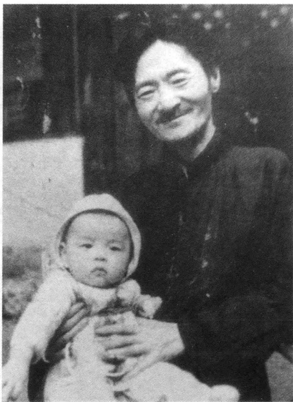
西南聯大時期的劉文典