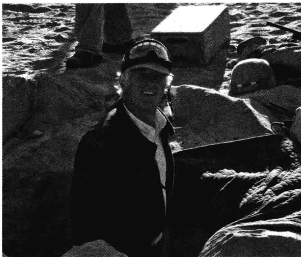
图1-2 罗杰·迪金斯(由安迪·哈里斯摄影,罗杰·迪金斯供图)

电影拍摄要把许多有创造力的个体整合为一个整体，这意味着把三个制作阶段的主创人员联合起来。制片人拿到剧本版权和资金，而且在幕后人员包括导演的选用上极具话语权。从总美术师（production designer）到服装设计，每一位参与创作的专业人员都致力于自己特定的任务。他们通过专注于各自的专业领域，形象化地阐释剧本。但是这个整合的过程起始于导演，其他人都仰仗着这个富于创造力的梦想家指引和领导。摄影师带领他的人马把一切记录在胶片上，美术指导设计场景，并与导演和摄影指导（以及美术部门和服装）一起创造出电影的视觉面貌。这种合作开始于筹备阶段并贯穿整个制作阶段。