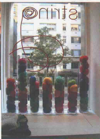
汇集了高级线的“String”的橱窗也很漂亮。