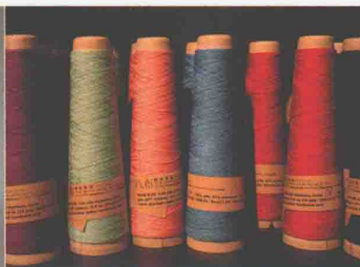
日本女性经营的“八布纺织品”，在世界各地都有粉丝。