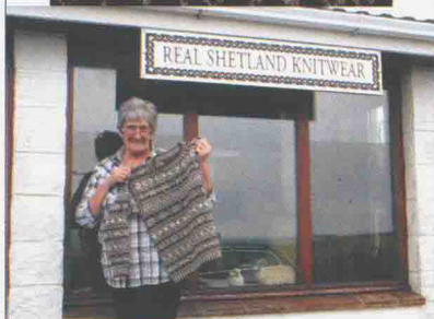
上/全部是羊毛原本的颜色。下/据说离开亲手编织的毛衣是让德雷恩·布朗觉得最寂寞的事情了。