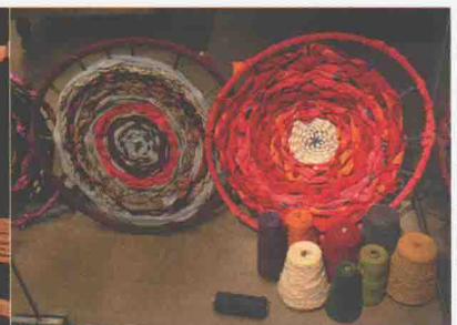
展示使用线、布制作而成的作品的MAD美术馆，汇集了许多手工艺家的作品。