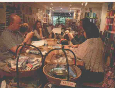
平易近人的“阿尼”周边有很多美术馆，位置很好。