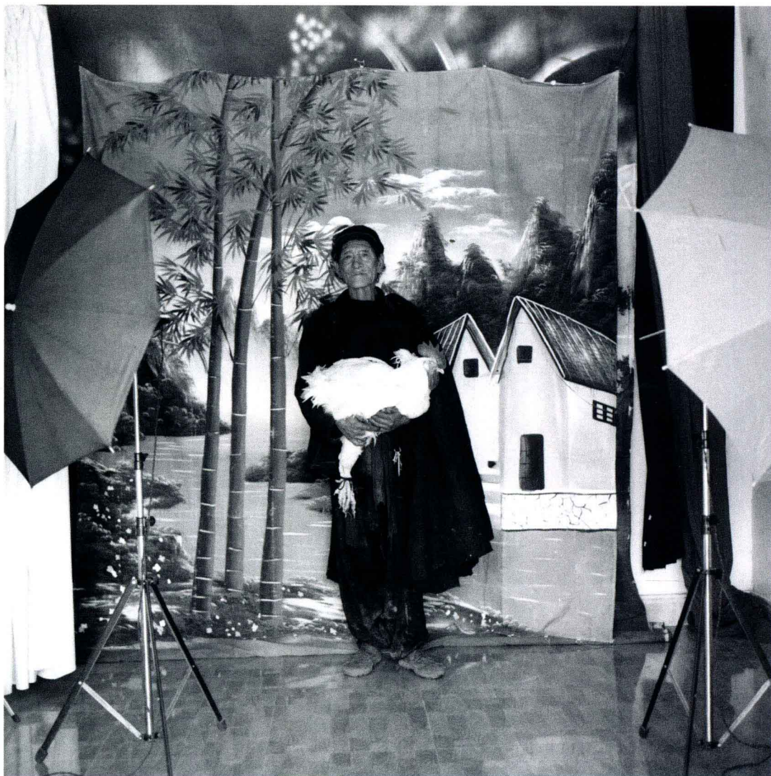
布拖特木里，四川，2001年