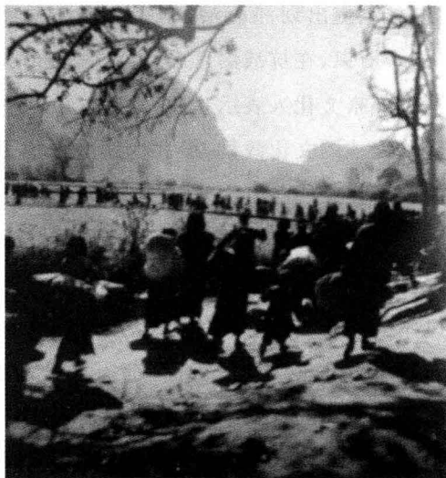
向桂林郊外躲避日军飞机警报的市民

行知当时也在桂林看到这种现象，首先想到在桂林搞岩洞教育，新安旅行团的小朋友们率先响应，利用日机轰炸躲警报的空隙教老百姓认字、写字、算术、唱歌，这就是抗战时期桂林独有的“岩洞教育”。现在七星后岩还有当年书写的“敌人在轰炸，我们在上课”的标语，桂林当时的文化扫盲在全国也是相当有名的。