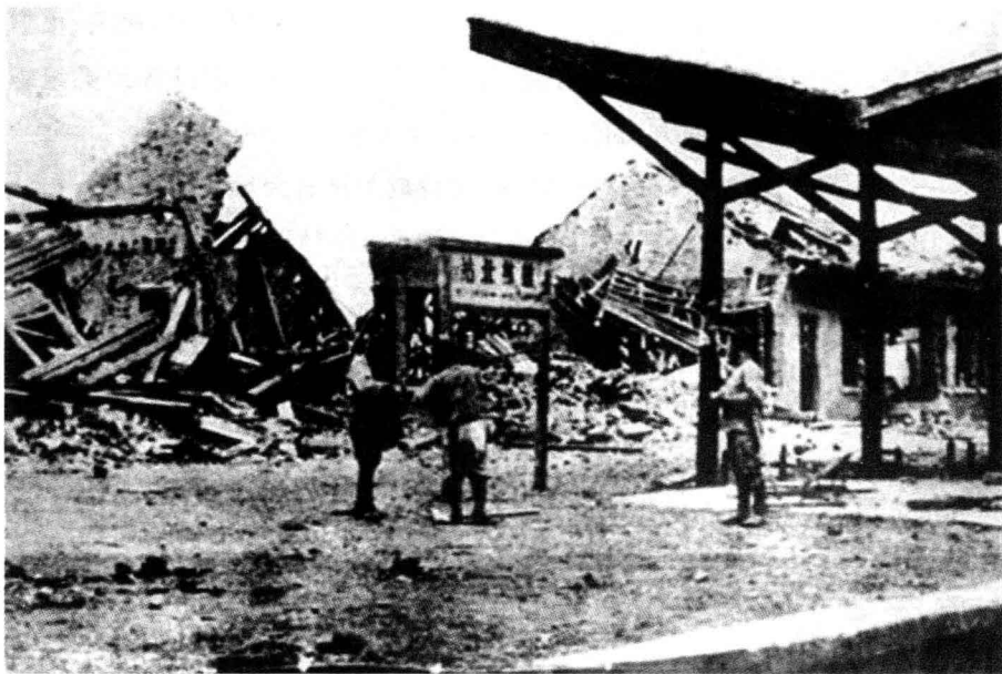
被日军飞机炸毁的桂林北站

后方城市之一，以及南部地区的军事重镇和重要的战略要地。当时的桂林既是中国大陆通往海外最便捷的国际通道上的中继站，又是新四军地区与重庆南方局、延安党中央秘密联络，以及中共地下党过往人员的必经之地。同时还是侵华日军打通中国大陆交通线，进攻中国南部地区以及中南半岛的必争之地。