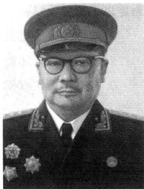
被授予上将军衔的李克农

正当李克农、钱壮飞、胡底三人小组在国民党特务机构里如鱼得水，准备大展宏图之际，忽然传来一个令人震惊的消息。1931年4月25日深夜，李克农在一家简陋的小旅馆里收到钱壮飞派人从南京捎来的密信，他看完信后，犹如五雷轰顶，一下子愣住了。中共特科行动科科长顾顺章在武汉被国民党抓捕后叛变，准备到南京面见蒋介石，密报中共中央、江苏省委和共产国际在上海的机关及中央领导人的住处，企图将共产党在上海的机关一网打尽，以此作为向蒋介石投降的见面礼。不巧的是接到密信这天又正好是星期六，并不是李克农与陈赓约定接头的日子，李克农找不到陈赓，就无法向中央报告这个十万火急的情报，中共中央首脑机关和领导人危在旦夕。从来都是办事镇定自若、不慌不忙的李克农，此时也很紧张，情急之下，他决定打破常规，找不到中央特科的陈赓，就先找在上海的江苏省委，因为他们是由陈赓联络的，找到了江苏省委，就能找到陈赓。半夜里两三点钟，李克农找到了中共江苏省委，并通过他们找到陈赓，然后又和陈赓马不停蹄地找到周恩来。当周恩来听到这个令人震惊的消息后，他立即决定采取措施，并