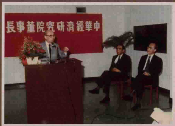
在嚴前總統家淦 先生主持的中華 經濟研究院董事 長交接典禮中。