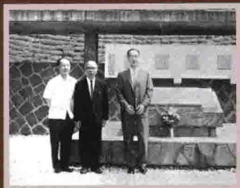
與中央研究院王世杰院長 （中）、劉大中院士（左） 攝於胡適墓園。