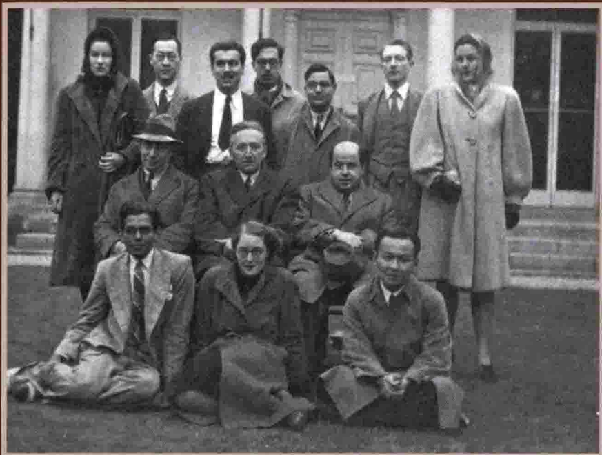
民國三十年六月攝於劍橋Grove Lodge。後排左二為蔣碩傑，中排中坐者為海耶克教授，前排右一為日後曾任泰國中央銀行總裁的Puey Ungphakorn。