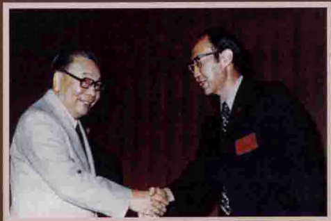
民國六十九年與 蔣經國總統合攝 於國建會。