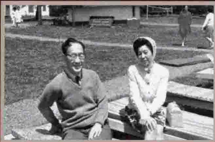
民國五十九年蔣碩傑伉儷在美國。