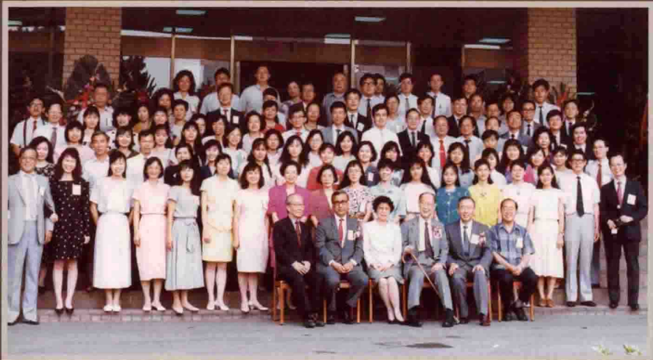
民國八十年七月中華經濟研究院成立十週年院慶和全體同仁合影。