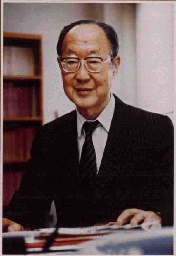
一九九二年攝於中華經濟研究院。