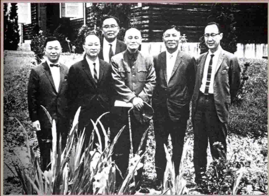
民國五十六年蔣碩傑蒙先總統蔣公接見於梨山賓館， 同時觀見者有（右起）李國鼎、費景漢、劉大中、顧應昌。