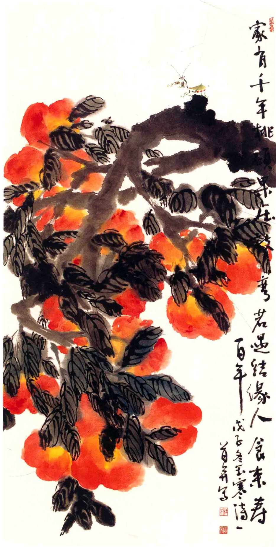
食来寿百年 136cm × 68cm 2008年