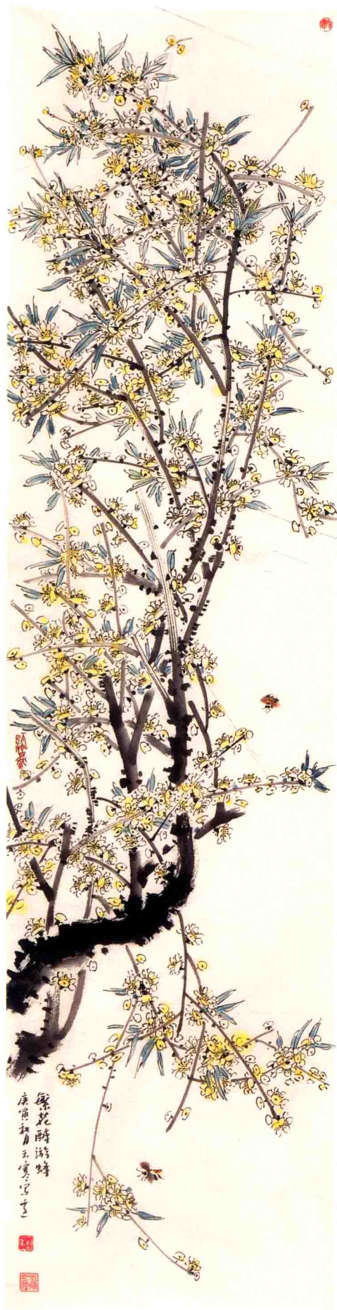
繁华醉游蜂 136cm × 34cm 2010年