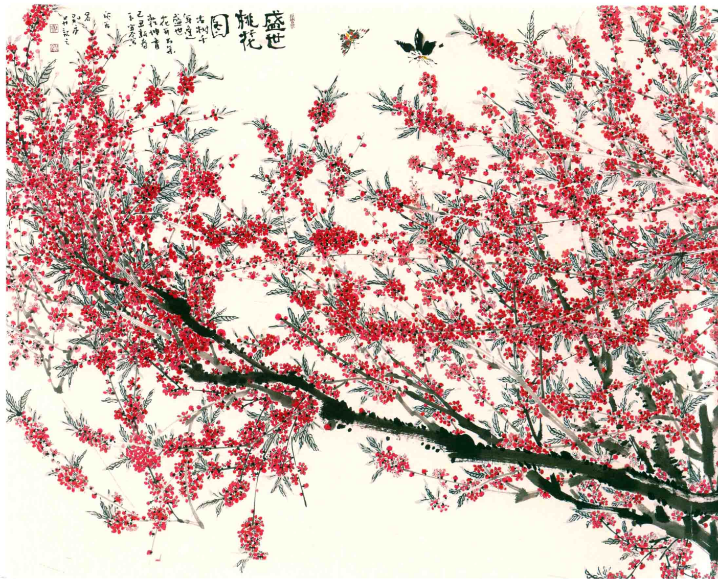
盛世桃花图 145cm × 365cm 2010年