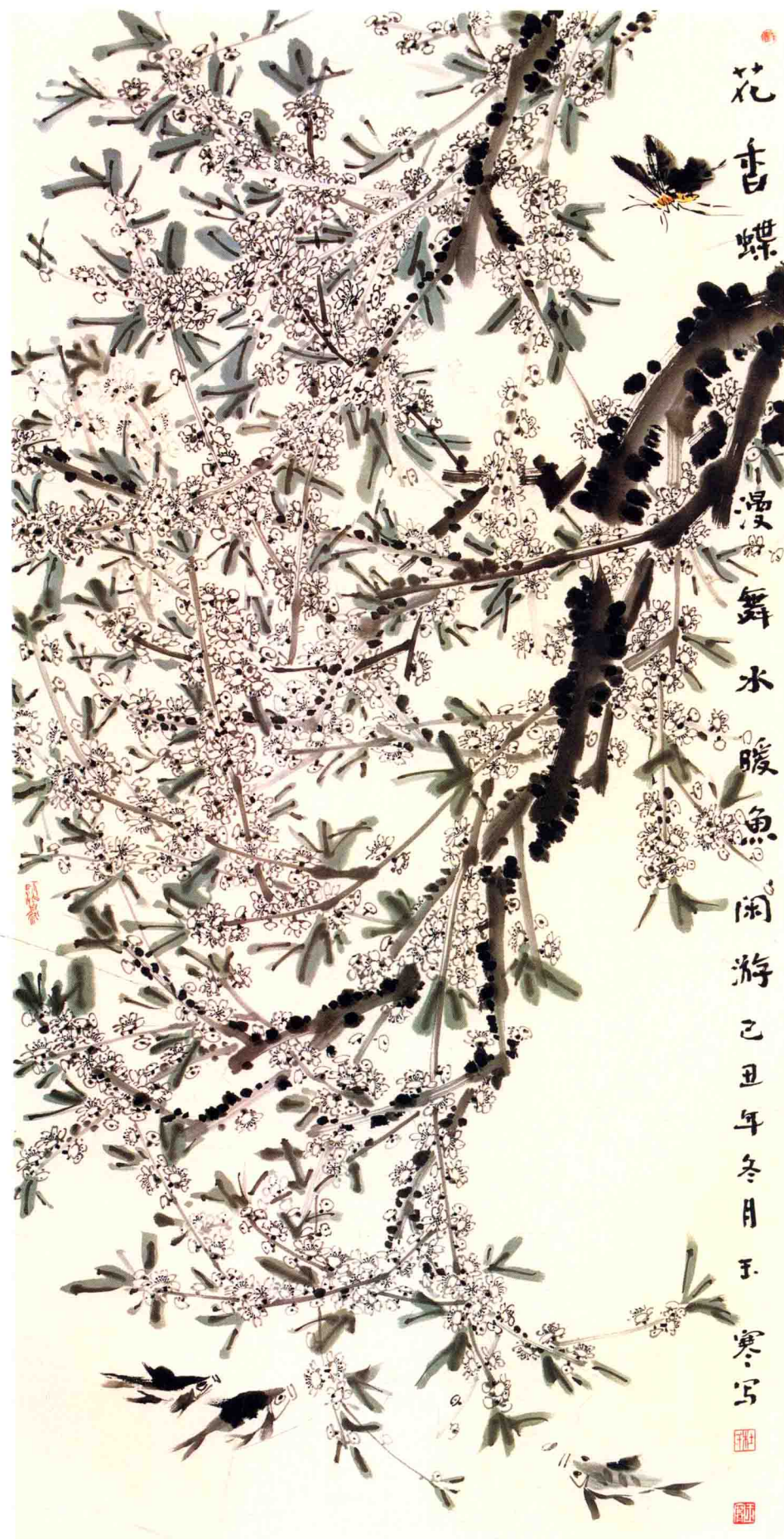
蝶舞鱼闲游 136cm x 68cm 2009年