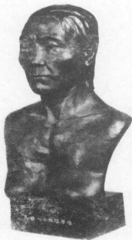
四千年前马桥居民的复原像

学会打井，是人类文明的又一个重大进步，扩大了先人的生存天地，使他们能够远离河流，深入内陆去寻找更多的生活资源。