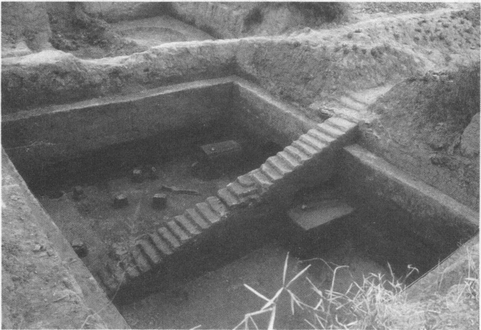
青浦福泉山古文化遗址发掘现场

良渚文化在今天青浦重固镇的福泉山传播开来，兴旺起来。他们在前人的马家浜文化和崧泽文化的地基上，创造了良渚文化后期的辉煌，使这边成了中国新石器