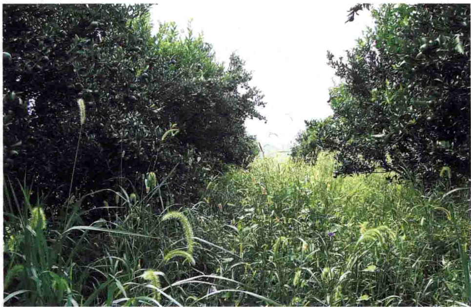
图1-3 杂草与果树相宜共荣

这让我们感觉太不值得，必须寻求省力的办法，很快“亮兜”一词被我们创造出来。所谓“亮兜”，就是只清理果树根兜附近影响果树呼吸及光照的杂草，而对其他并不碍事的杂草完全放任它们自由生长。但杂草终究是杂草，放任的杂草大多长到 50 厘米左右时，就停止长高而进入生殖生长了，这根本影响不到果树。因此，果园的锄草工作很快就变成了只针对那些高秆、灌木、藤蔓类杂草，工作变得简易多了（图 1-3）。