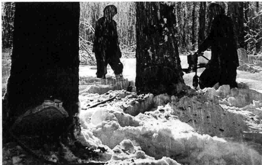
图1-1 曾经在神农架伐木的场景

看到那些让人无比敬畏的参天大树被锯成一片片小小的地板，内心的痛惜越来越强烈，自我抵触的情绪也越来越重。而且柴油机锯树的尖叫刺耳声总是令人心情烦躁不安，但无论愿意不愿意，这种高分贝的噪声总是跟魔鬼一样死死地缠绕着我，无法躲开。