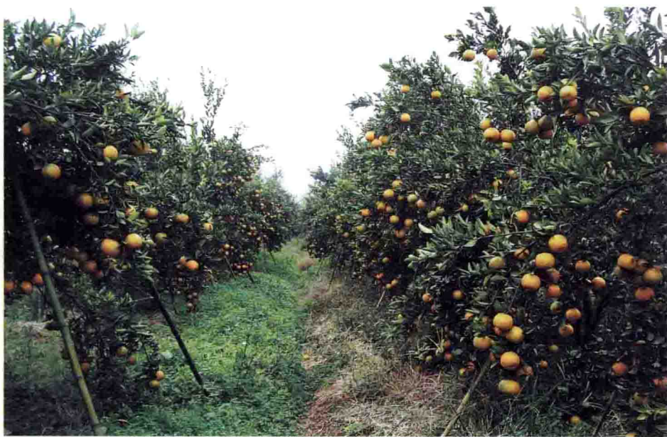
图1-4 椪柑园的丰产情景