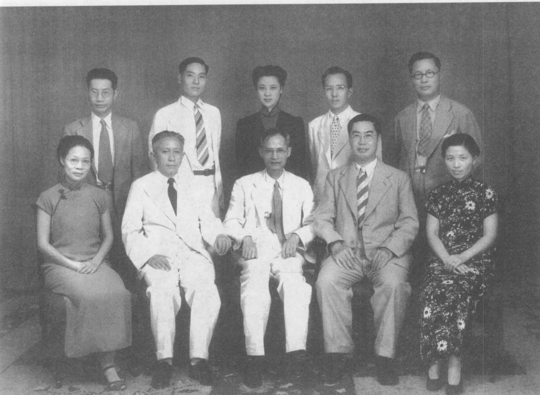
1941年国民参政会亲善访缅甸留影