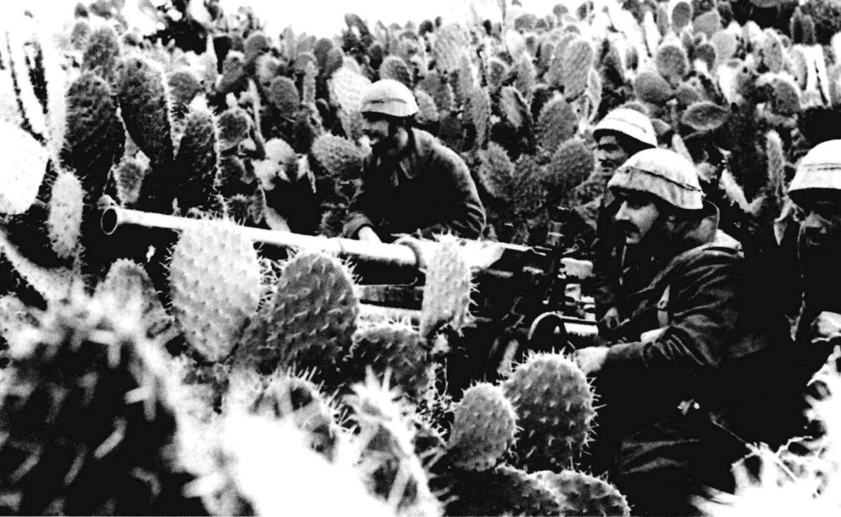
装备M1935型47毫米反坦克炮的意大利士兵正隐蔽在沙漠的仙人掌丛中

1939年9月3日，第二次世界大战全面爆发。德国元首希特勒怀着征服世界的梦想，开始了一系列征服计划的实施。他屡战屡胜，似乎再没有人能够阻挡他称霸世界的野心。在这个时候，墨索里尼也不甘落后。他一直是个不“甘于平庸”的人，看到希特勒的接连告捷，他也希望借机出兵，实现他的“伟大理想”。在思考了一段时间后，他把目标锁定在了那片古老而贫瘠的土地上。虽然他无法获得意大利人民的广泛支持，但他渴望用征服世界的方式来赢得人民的尊重。他不顾一切反对的声音，在利比亚、厄立特里亚和意属索马里等地建立了自己的殖民地，并且在1936年侵占了埃塞俄比亚，又于1939年攻占了阿尔巴尼亚。尽管占领这些弱小国家看起来有些胜之不武，但是却极大地刺激了墨索里尼的“进取心”。他准备乘势前行，在1940年6月向英法宣战。他用自己的态度表明，自己已经站到了德国一边，与希特勒结为同盟。这一系列的军事行动，把意大利拖入了战争的深渊。