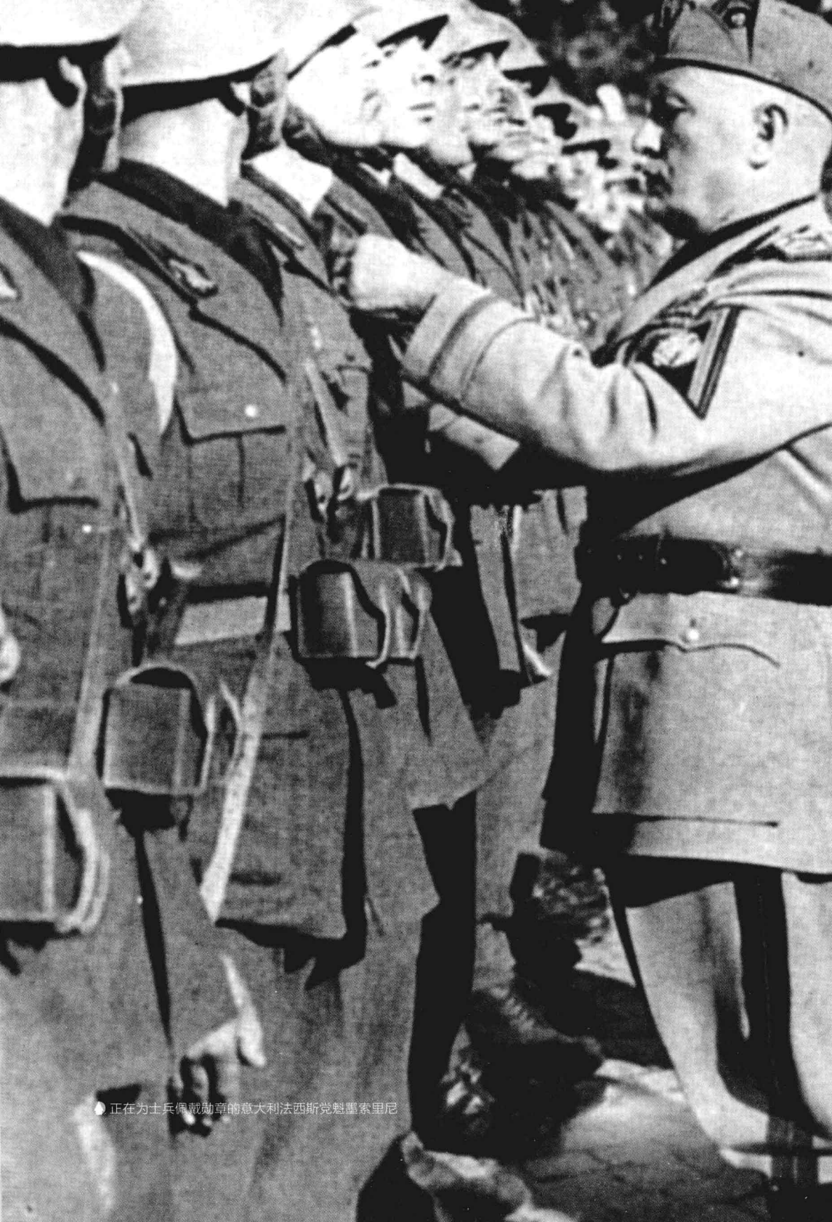
正在为士兵佩戴勋章的意大利法西斯魁墨索里尼