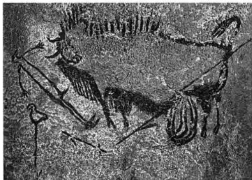
图 1-2 法国拉斯科洞窟壁画

拉斯科洞窟壁画的马中,最令人瞩目的是所谓的“中国马”(图1-3),其因形体颇似中国的蒙