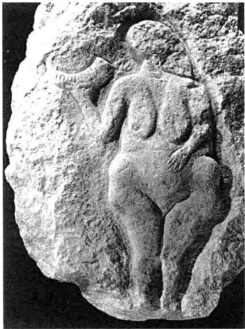
图1-7 手持角杯的裸女

《手持角杯的裸女》为法国鲁塞尔岩廊石壁浮雕,也是奥瑞纳时期的作品。这位女子右手托着一只角状器,左手搭在稍为隆起的腹上,披肩长发绕在左肩,袋状的双乳悬挂在胸前,腹部和臀部宽厚肥硕,面部简略未作刻画,粗壮的大腿往下细小而至于虚无。从形象动作的姿态特征中,人们猜想这位女子正在主持一项巫术仪式,祈祷猎物丰收和部族昌盛、安康。也有人认为她手中托举的角器是人类繁殖的吉祥物,表明她那母性的潜力不再隐藏在自己的身体内,而是寄托于神秘的象征——兽角。