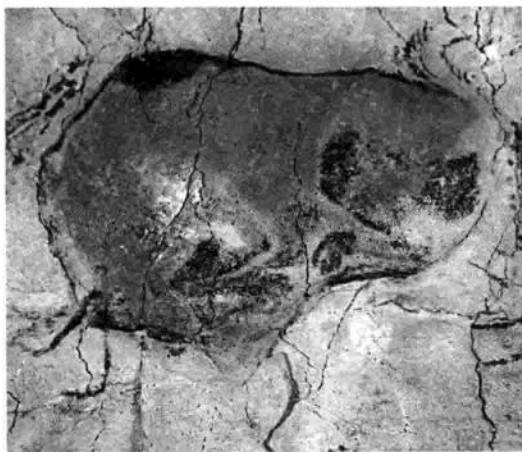
图 1-1 西班牙阿尔塔米拉洞窟壁画

1879年在西班牙北部桑坦德市的阿尔塔米拉洞穴内发现了旧石器时代晚期壁画。欧洲旧石器时代洞窟崖壁画最显著的特点是：（1）写实的大型动物形象；（2）形象之间没有相互的联系；（3）各种抽象的符号。这些特征在西班牙阿尔塔米拉洞窟崖壁画中体现得最为鲜明。洞穴长270米，大部分壁画分布在长18米的侧洞的顶和壁上，为公元前3万年到公元前1万年左右旧石器时代晚期的古人绘画遗迹，称“马格德林文化”。内容主要是涂有红、黑、紫色的成群野牛，还有野猪、野马和赤鹿等，总数达150多只。这些动物形象描画得细腻生动，栩栩如生。洞中还有镌刻的人物形象及手的轮廓图形等。在洞穴前部，发现了旧石器时代晚期文化的遗物，为确定岩画的年代提供了证据。一般认为，壁画内容可能与原始人祈求狩猎成功的巫术活动有关。阿尔塔米拉洞窟壁画轮廓线比较细，而且有明暗向背的粗细浓淡变化，与色彩渲染结合紧密，通过动态表现动物身体的结构，明暗起伏较为丰富，感情也较细腻，但却不如拉斯科洞窟壁画那样奔放有力。