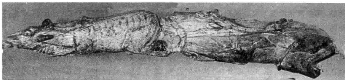
图 1-5 法国鹿角雕刻

在热尼埃遗址出土的一块宽 7.6 厘米的石片上，刻有欧洲野牛，用线生动流畅，蹄子结构刻得颇为准确。出土于法国劳尔泰洞中的用驯鹿角制作的骨杖也是一件非常出色的线刻作品，上面刻满图画，全长 24 厘米。若将其展开，便可以看到一幅精彩的场景：三只驯鹿缓步行于水中，几尾鲑鱼穿梭于鹿腿之间，最后一只驯鹿警惕地回顾后方，画面就此断掉。显然作者是借助于穿梭的鱼来虚写河流，并成功地刻画了最后那只驯鹿回首警惕的表情。这表明当时的创作者已具备了充分的观察和表现能力及技巧。