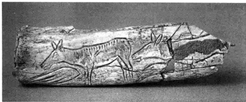
图 1-4 瑞士骨雕驯鹿