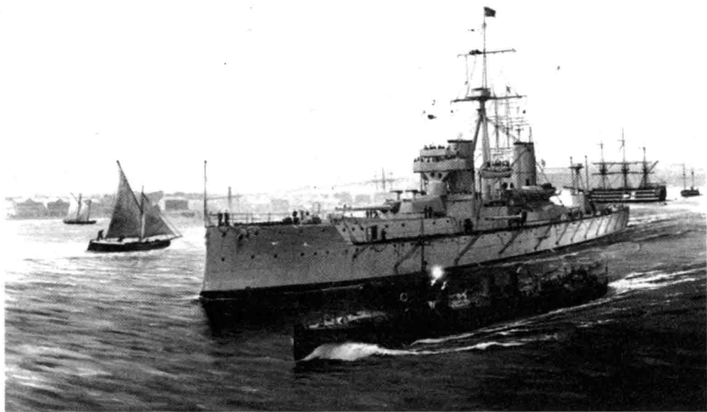
英国无畏级战列舰

意大利等国分别建造了4艘无畏舰，英国的海军优势受到了挑战，英国人心惶惶。1909年，欧洲战争气氛越来越浓。