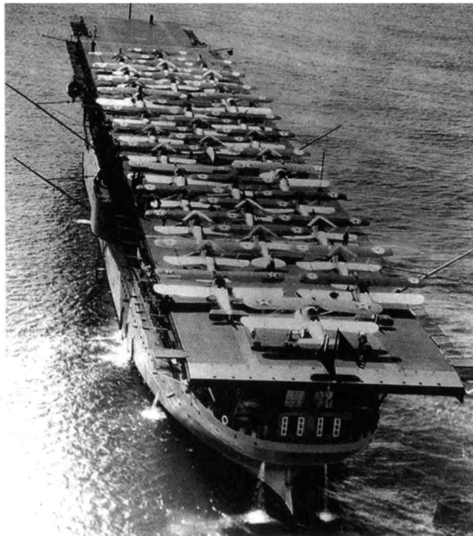
美国早期的航空母舰“兰利”号

在第一次世界大战爆发以前，各国的主要精力是用于建造“无畏舰”，航空母舰除了搭载水上飞机外，在设计上的突破缓慢。