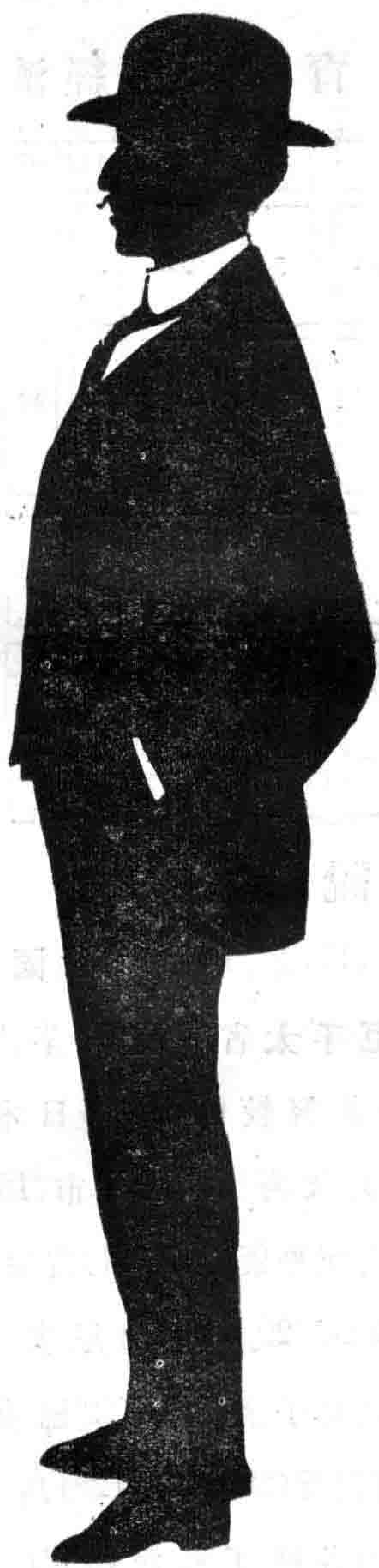
巴拿馬萬國博覽會場美國霞門女士剪像 炎培