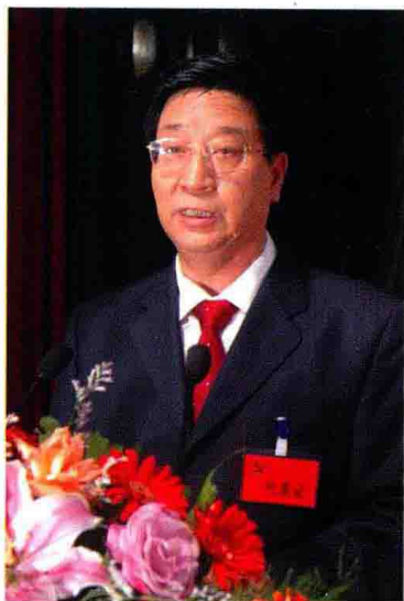
市委书记朱绍毅在市第十次党代会上

丹东位于辽宁省东南部的凤凰山麓、鸭绿江畔、黄海之滨，与朝鲜一衣带水，是一座山清水秀、风光旖旎的边境港城。这座因抗美援朝战争而举世闻名的英雄城市，改革开放初期曾跨入全国十个“新兴明星城市”行列。但在实行社会主义市场经济体制以后，由于多年积累的体制性、机制性和结构性问题，经济一路下滑到辽宁各地市的后列。近年来，市委、市政府紧紧抓住沿海开放和老工业基地振兴两大机遇，以科学发展观为统领，审时度势，科学确定城市发展定位和总体发展思路，并以深化改革、扩大开放为突破口，使丹东经济呈现出加快发展的良好态势。2005年全地区生产总值增长16%，规模以上工业增加值增长31%，地方财政收入增长22.5%，农民人均纯收入和城市居民人均可支配收入分别增长9.3%和13.9%，各项重要经济指标增长速度