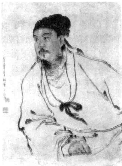
关汉卿画像 李斛 绘

(冲末 ⑨ 扮窦天章引正旦 ⑩ 扮端云上,诗云)读尽缥缃万卷书,可怜贫煞马相如,汉庭一日承恩召,不说当垆说子虚 ⑪ 。小生姓窦名天章,祖贯长安京兆 ⑫ 人也。幼习儒业,饱有文章;争奈 ⑬ 时运不通,功名未遂。不幸浑家亡化已过,撇下这个女孩儿,小字端云,从三岁上亡了他母亲,如今孩儿七岁了也。小生一贫如洗,流落在这楚州居住。此间一个蔡婆婆,他家广有钱财,小生因无盘缠,曾借了他二十