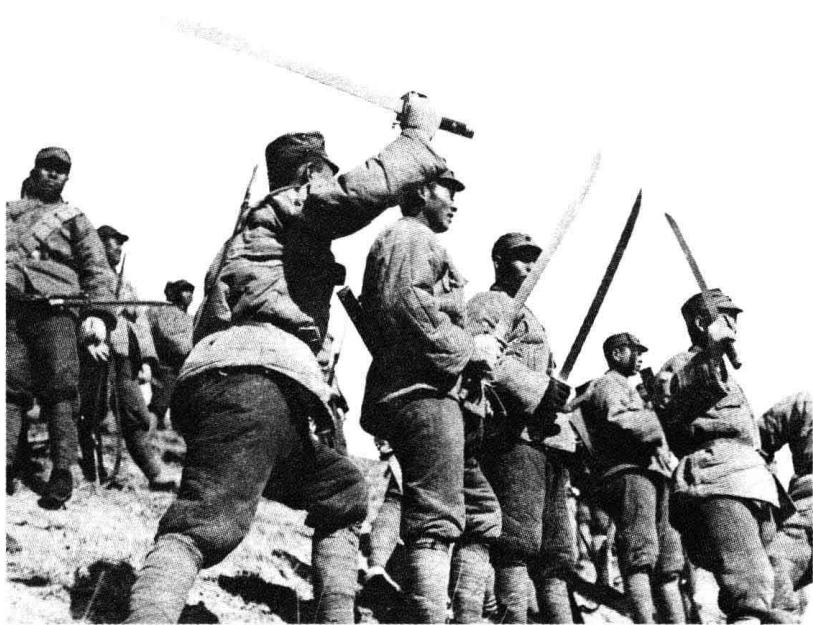
↑ 为了获得中国东北部满州里资源丰富的地区，日本于1931年占领了奉天城（沈阳的旧称）。

1931年11月4日，日军向当时的黑龙江省府齐齐哈尔发动进攻时，东北军爱国将领马占山毅然下令坚决还击，在江桥打响了东北军有组织抵抗日本侵略的第一枪，马占山所部与日军血战江桥，鏖战了半个月，由于敌众我寡，没有后援，最后不得不撤离江桥。这是中国军队对日本侵略军第一次正式抗击，马占山的名字，迅速传遍全国，成为了当代的“爱国军人”和“民族英雄”，从此名垂史册。