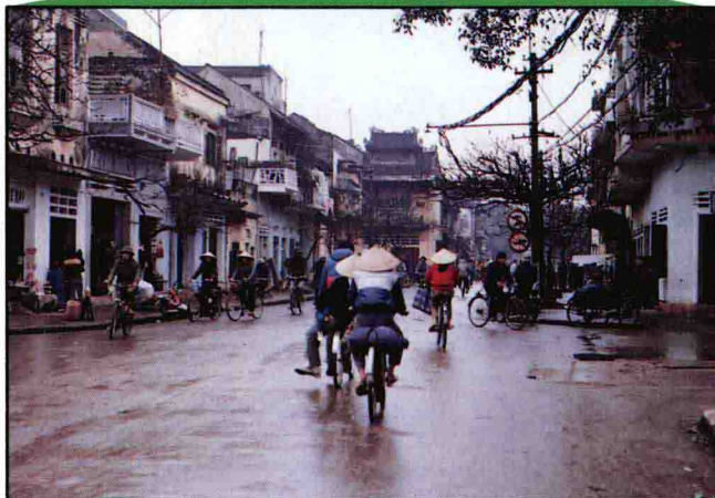
▼下圖南定市區街邊的理髮情形