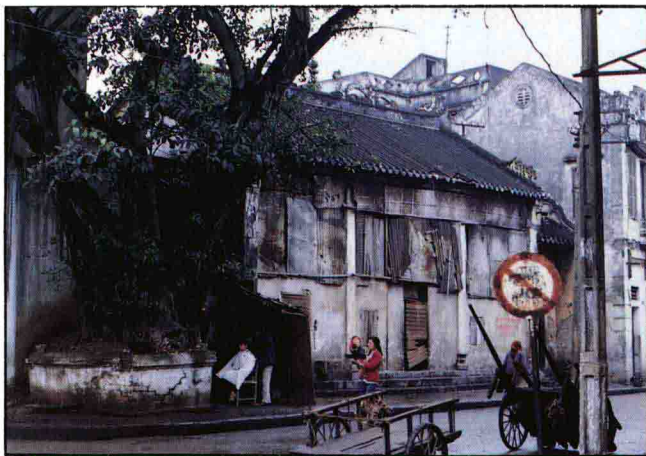
▲上圖雨中的南定市區