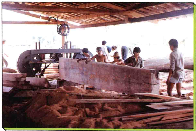
▲上圖鋸木廠工作情形