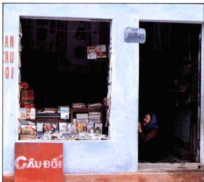
▶ 越南喪家的擺設情形