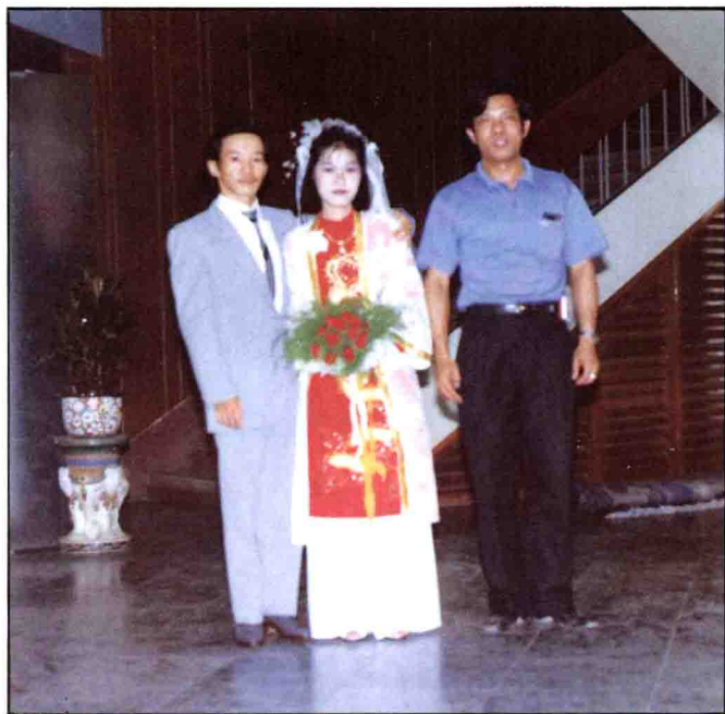
◀ 上圖作者與婚禮中之越南新郎與新娘