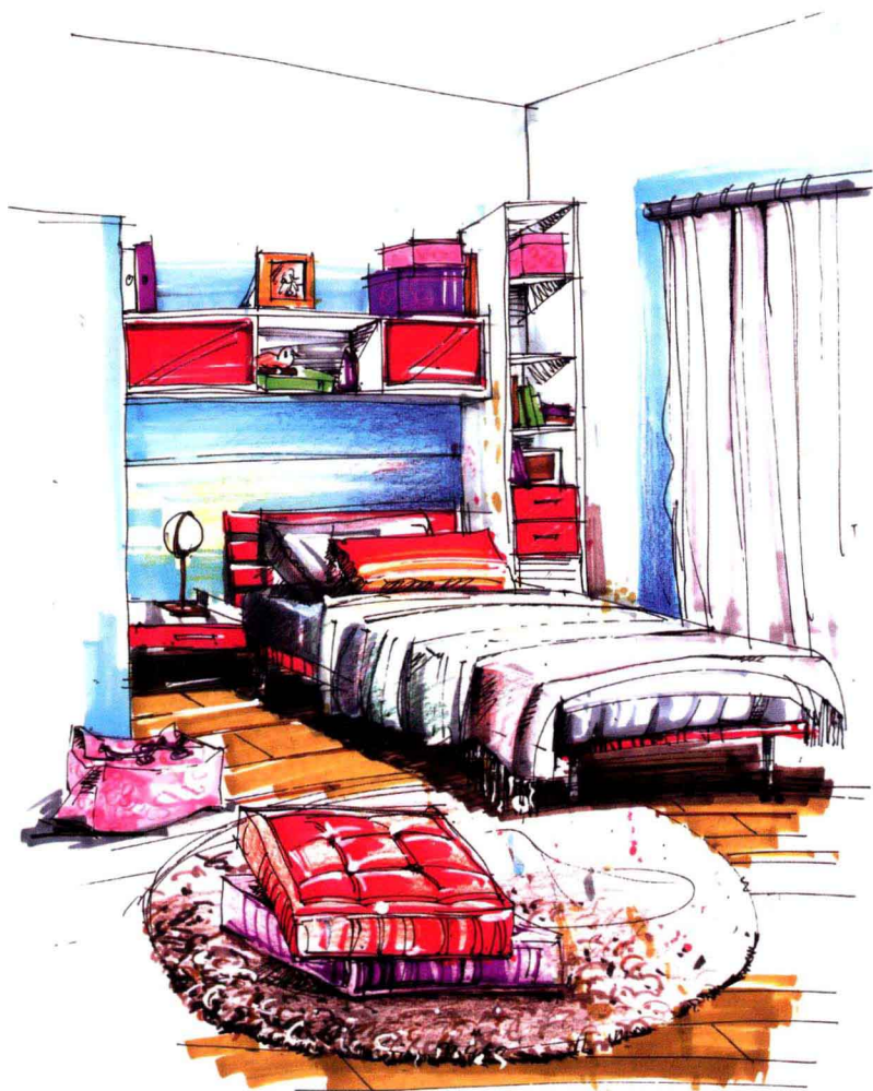
图1-2 卧室手绘效果图

手绘效果图表现已经成为室内设计师、环境艺术设计师、园林景观师、城市规划师、建筑师等专业人士的必修技能之一，手绘效果图表现一直以来都受到专业设计人员与各高等院校在校学生的重视。手绘效果图表现是设计师表达自己设计语言最为直接和有效的方法，可贯穿整个设计过程的始终，且以其强烈的艺术感染力传递着设计的语言、思想、理念和情感，成为解决设计过程中所出现的问题最方便与快捷的手段。手绘效果图表现有如下几个特点(图1-2)。