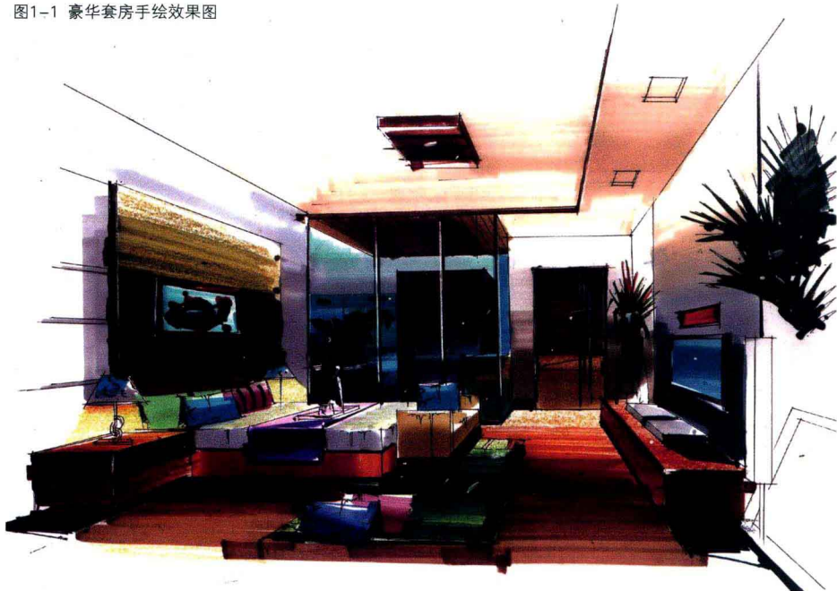
图1-1 豪华套房手绘效果图

随着时代的发展及计算机辅助设计的广泛应用，很多设计施工图、效果图都是用计算机辅助设计来表达，如CAD、3DSMAX等设计软件就在建筑、室内、园林工程建设等领域发挥了很大的作用。而我们要说的是，设计是灵魂的创意和创新，灵魂的表现载体虽然通常可以通过电脑辅助设计来实现，但更重要的是它必须通过手绘的形式来形成和实现。