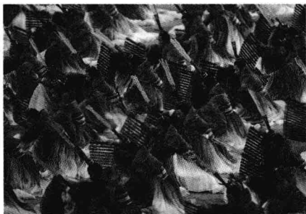
2008年北京奥运会开幕式节目：3000孔子弟子手执竹简，高声吟诵《论语》。

古人云：“凡饮井水处，皆能诵《论语》”。我没有想到，在2008年北京奥运会这一宏大唯美的盛典上，历史回归了！当孔门三千弟子忘情吟诵《论语》，当清脆悠远的竹简清音和馥郁飘逸的儒门书香漫卷而来，人们由衷感受到一种久违的从容与优雅。我多么希望，那峨冠博带的三千弟子所发出的震撼吟诵，既是中华儿女的虔诚缅怀，更是全体国民对自身文化信仰的最后一次救赎！