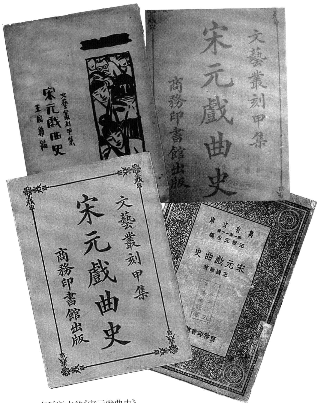
多種版本的《宋元戲曲史》。 上右《文藝叢刻》本為一九一五年初版。