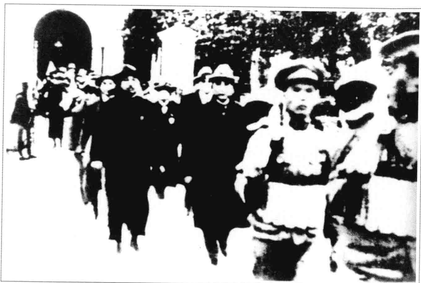
孙中山、李大钊步出国民党“一大”会场的情景