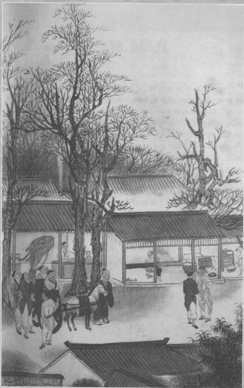
夷门访贤 清·吴 历