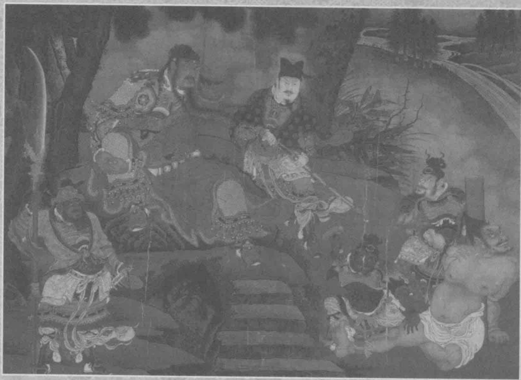
关羽擒将图 明·商喜