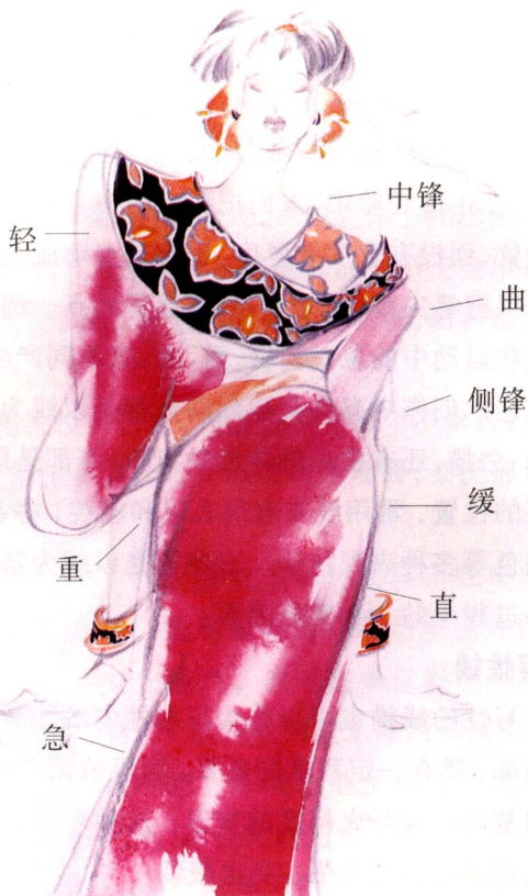
此作品借鉴了国画工笔风格,利用透明水彩进行湿画,与退晕两种方法相结合。线是利用速写的线,用2B、3B的铅笔勾线。

总之速写性的线,是服装画中一种重要的表达形式,但在运用流畅变化的线条同时注重线的表现实质,是使着装后的人体造型更具准确性的重要之处,也就是说,优美的线条能帮助你更充分地表达人体美和服装美,而不能只考虑线条虚实、韵律,而忽视服装画的重点——人体服装的表现。