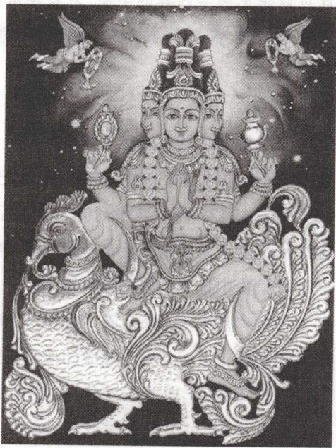
四面佛原名“大梵天王”，为印度婆罗门教三大神之一，是创造天地之神、众生之父，具备崇高之法力。印度传说梵天用嘴创造了婆罗门，用手创造了刹帝利，用腿创造了吠舍，用脚创造了首陀罗。