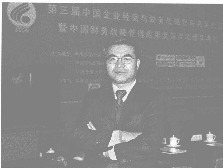
2006年11月,于北京钓鱼台出席年度会计师人物颁奖活动