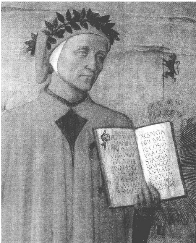
图 1-2 但丁

大体上，也在这一时期的前后，在意大利，出现了一位尽人皆知的伟大诗人但丁。他曾经参加了当地的政治斗争，体悟到了人世间的烦恼、纷乱和不愿闻问的悲剧，于是写了著名的《神曲》，写了同样著名的《新生》，为此，后来研究但丁的学者把他称作一位政治人文主义者。同在这个时期，还出现了一位非常著名的阿奎那*，