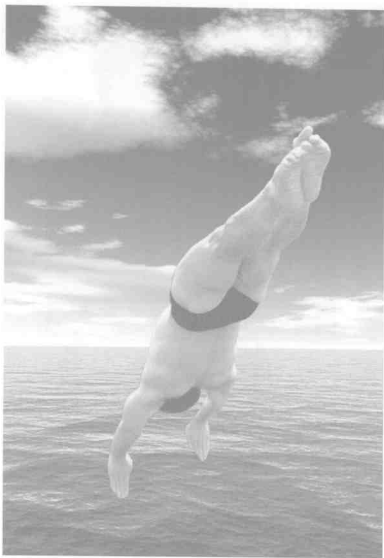
作者海阔凭鱼跃动作照