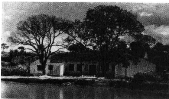
少年刘少奇念私塾的地方

这个罢工的。但罢工未结束，中国著名煤铁公司汉冶萍之下萍乡煤矿工人又闹风潮，我又到江西西部的萍乡煤矿，在那里指导了全矿工人的罢