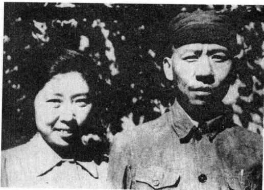
刘少奇和夫人王光美在西柏坡

由一九二七年至一九三四年，在两条路线的斗争中，刘少奇一直坚持与毛泽东等同志一致的正确路线，数次被坚持错误路线的领导人撤职或调换工作。