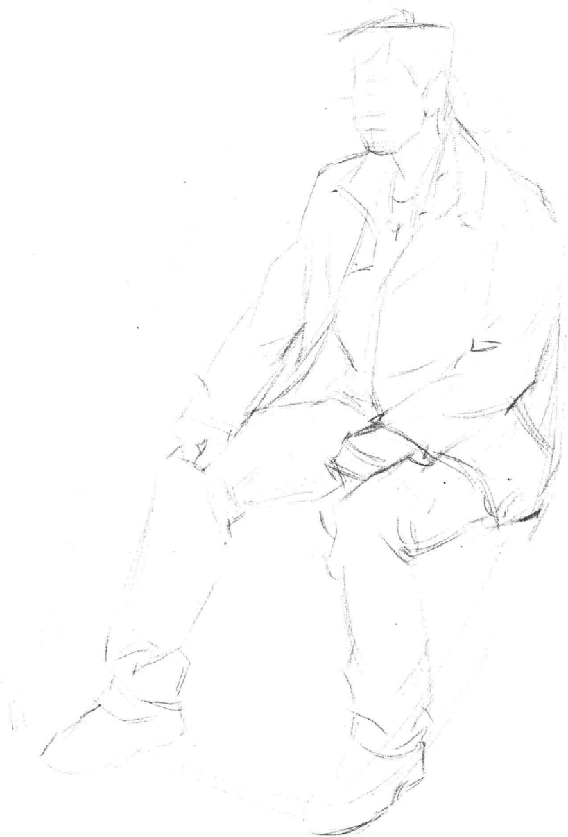
深入起形，丰富细节部分。注意用线要轻，自己能看清楚就可以，尽量保持画面整洁。