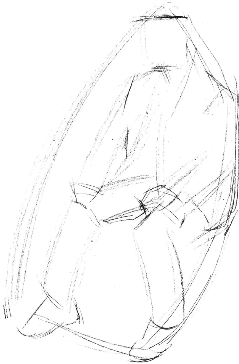
通过整体构图高度决定头部大小，再通过头部大小确定各部分比例，进一步完善动态、比例。基本不做细节描绘。