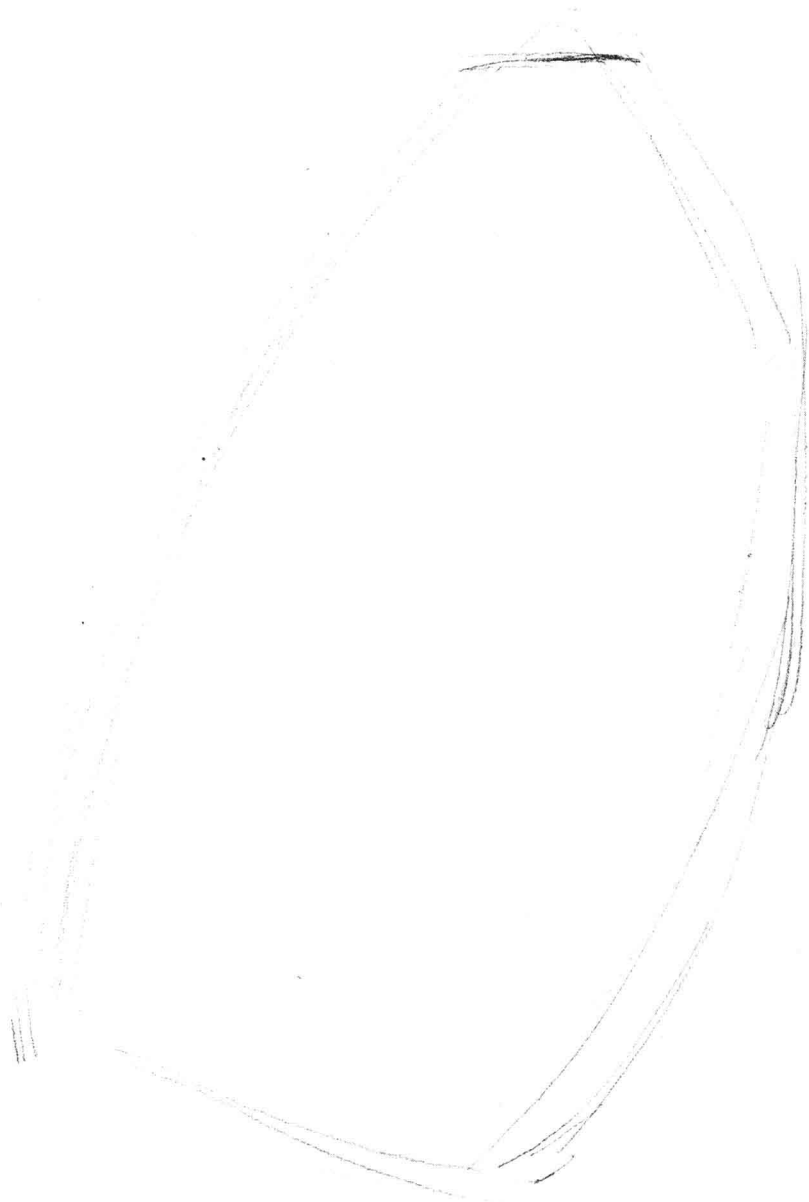
长线虚构外轮廓。抓住最长的线解决构图和动态问题。