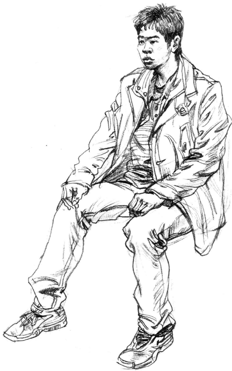
逐步刻画。从头部推着深入，刻画中注意主次、疏密等关系的具体体现。