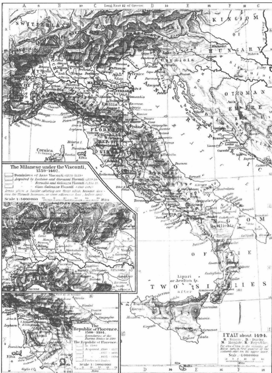
图片说明：古代“威尼斯共和国”（公元697~1797年）15世纪的“版图”，约为1494年时“威尼斯共和国”（意大利右上方）的“疆域”。