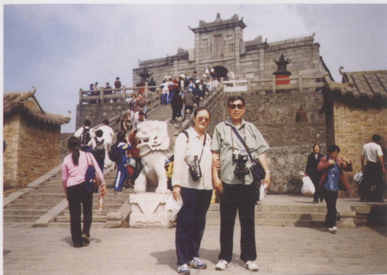
作者和夫人在南嶽衡山 祝融峰(2002年5月)