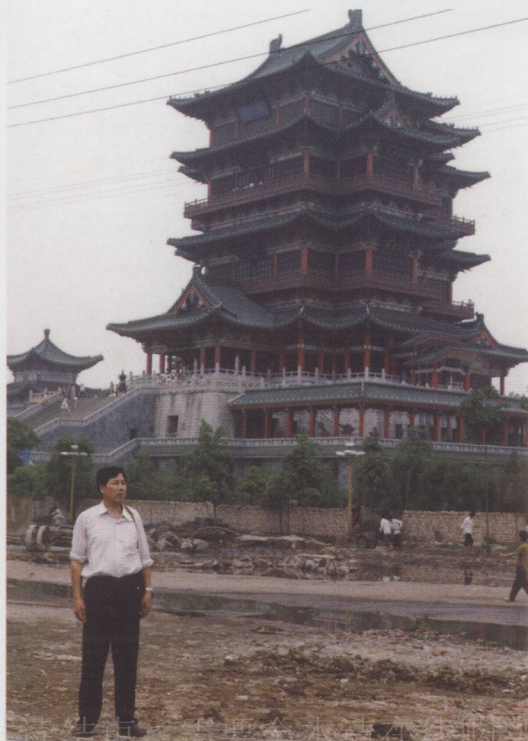
作者在江西滕王閣 (1992年7月)