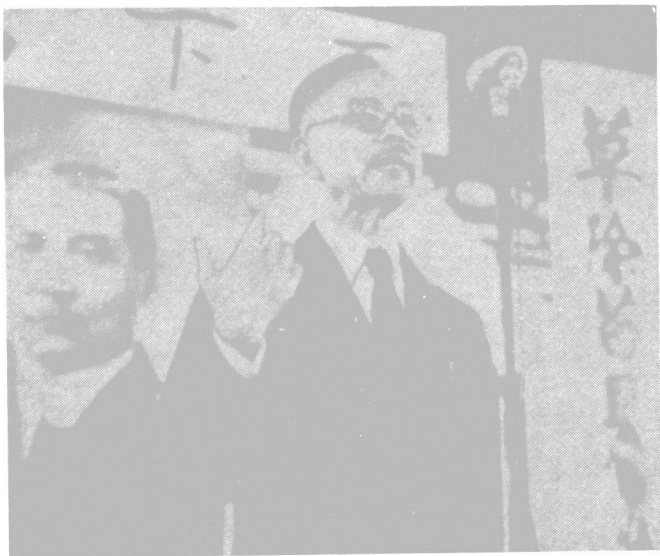
陳嘉庚在南洋華僑籌賑會上發表演說