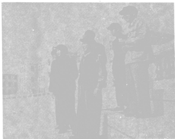
陳嘉庚視察廈門大學建築工程