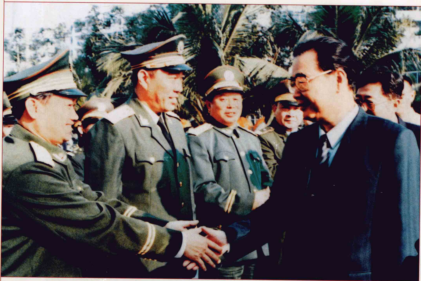
时任国务院总理李鹏与总队领导亲切握手。