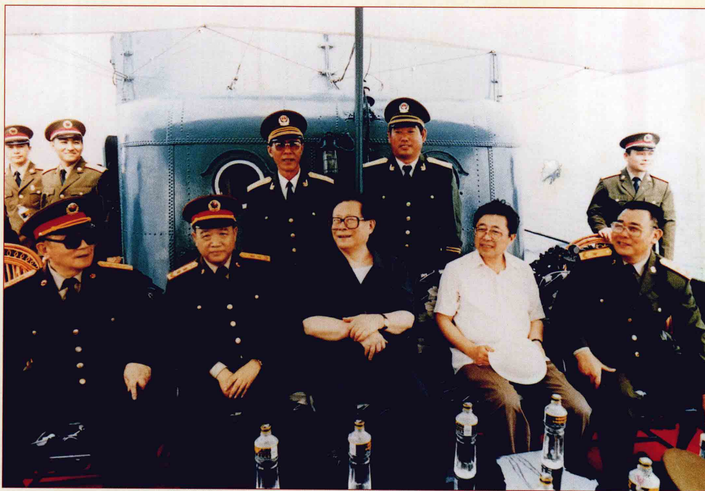
1993年4月18日，军委主席江泽民乘坐海警“海公511”巡逻艇视察驻琼某部，并为海南边防总队题词：“维护海上治安，保卫特区建设”。