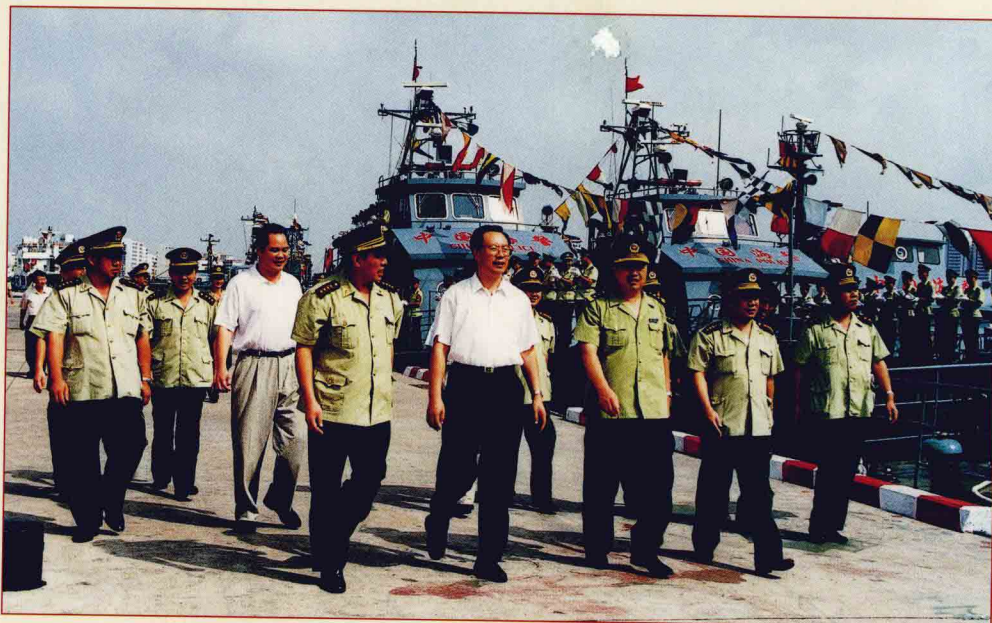
农业部部长杜青林（右四）在任海南省委书记、省人大主任期间到总队海警部队视察工作。