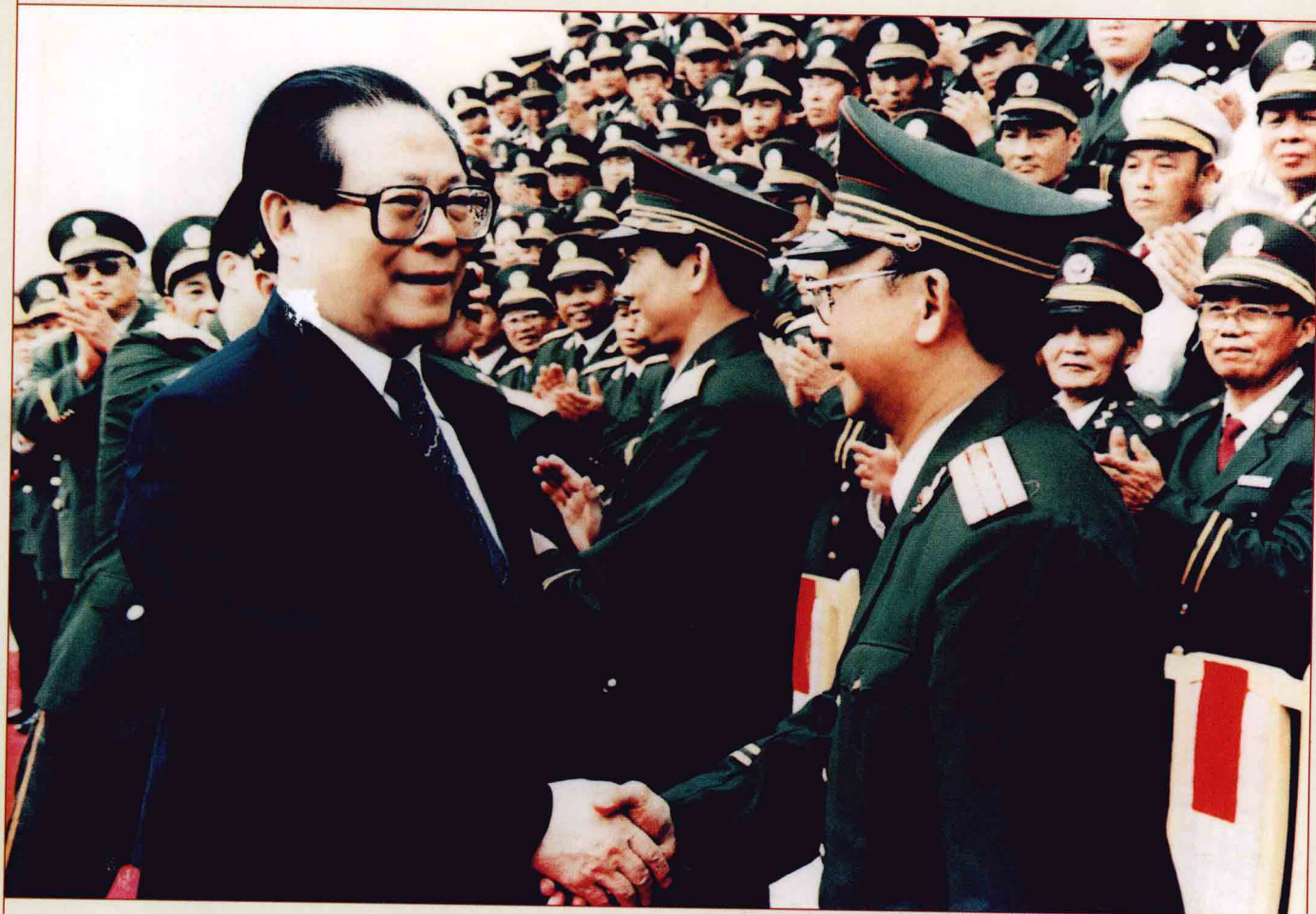
军委主席江泽民在海南省视察工作时接见海南公安、武警、边防、消防、团（处）级以上干部。图为江主席和总队原副总队长黄培坤亲切握手。