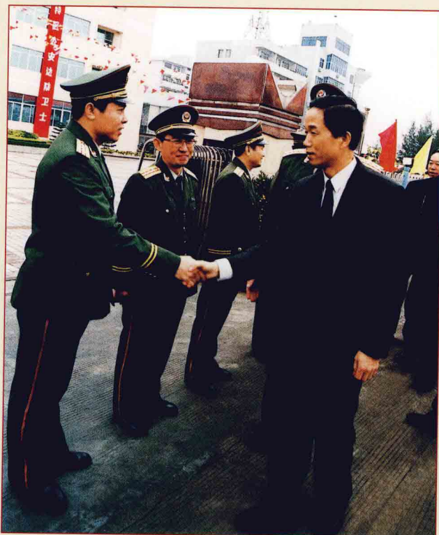
最高人民法院检察长贾春旺在任公安部部长期间视察海警部队时与总队领导握手。