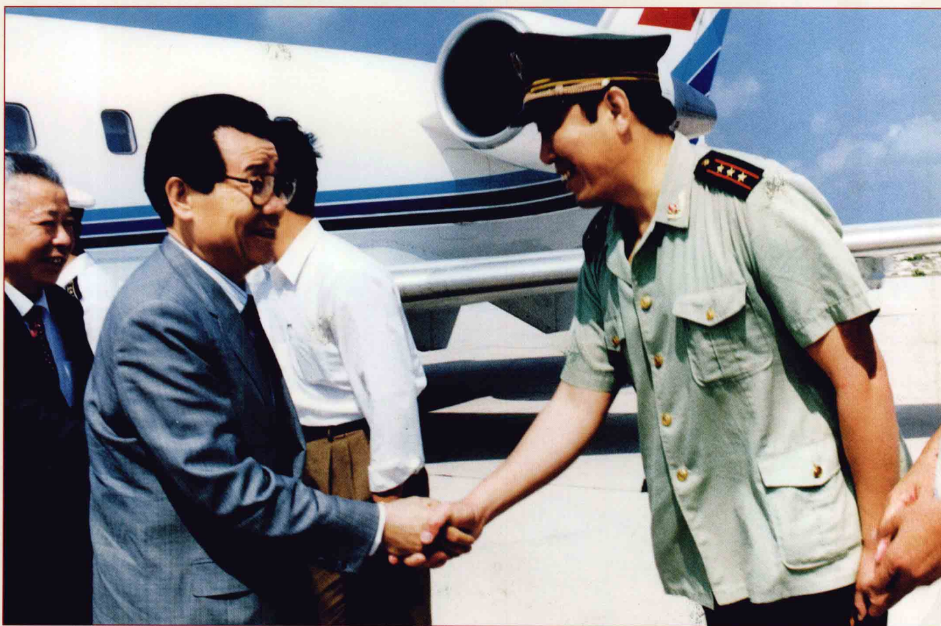
时任全国政协主席李瑞环在海南视察工作时与总队原总队长冯海龙亲切握手。