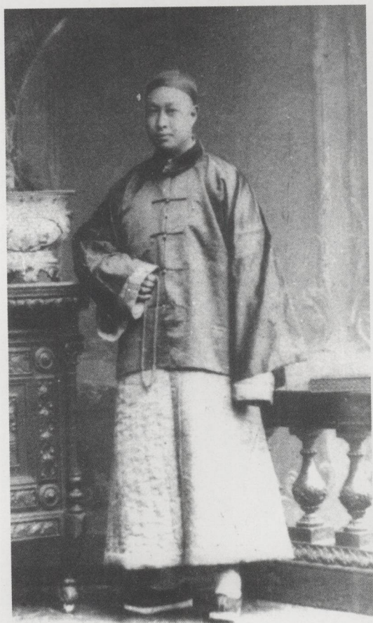
青壮年时代的杨文会