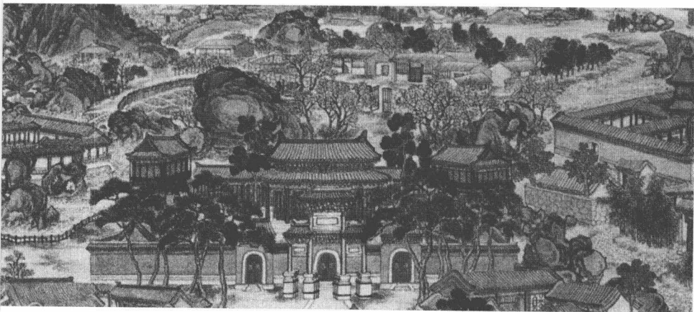
◎大观园全景图（局部） 清·孙温 绘