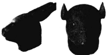
法国佳士得公司拍卖的中国流失文物圆明园兔首和鼠首铜像