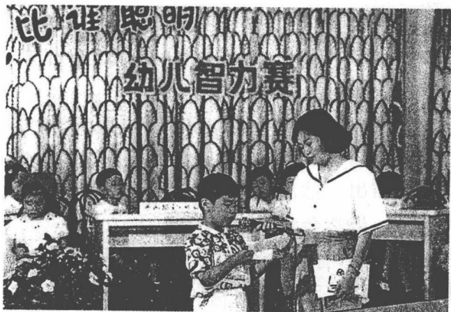
《开心娃娃》举办幼儿智力赛

这一时期的少儿节目内容不断丰富。从以前单一的进口动画片发展成多种类型。1990年5月30日至6月9日,上海电视台举办了海外儿童节目展播,播出了由国际部引进和编辑的海外儿童节目《七色花——海外儿童节目荟萃》,共13集,每集半小时,由希腊、葡萄牙、联邦德国、朝鲜、苏联、匈牙利、埃及、卢森堡、加拿大、新加坡等国家电视台提供。节目类型有动画片、歌舞、社教专题等。