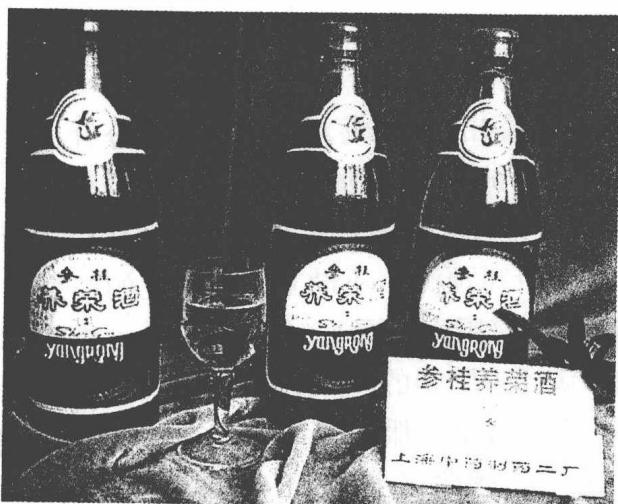
1979年1月28日上海电视台播出的 第一条电视广告片

这组广告在当天20时40分再播一次。1月28~31日连续四天,每天播出两次,共播放8次。