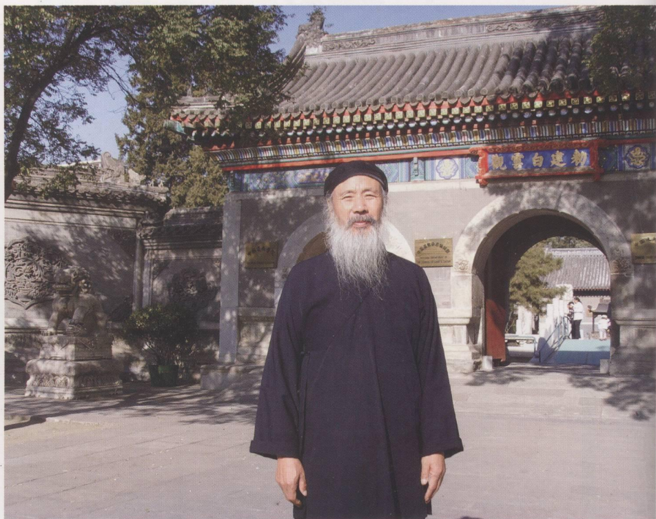
中国道教协会会长任法融大师