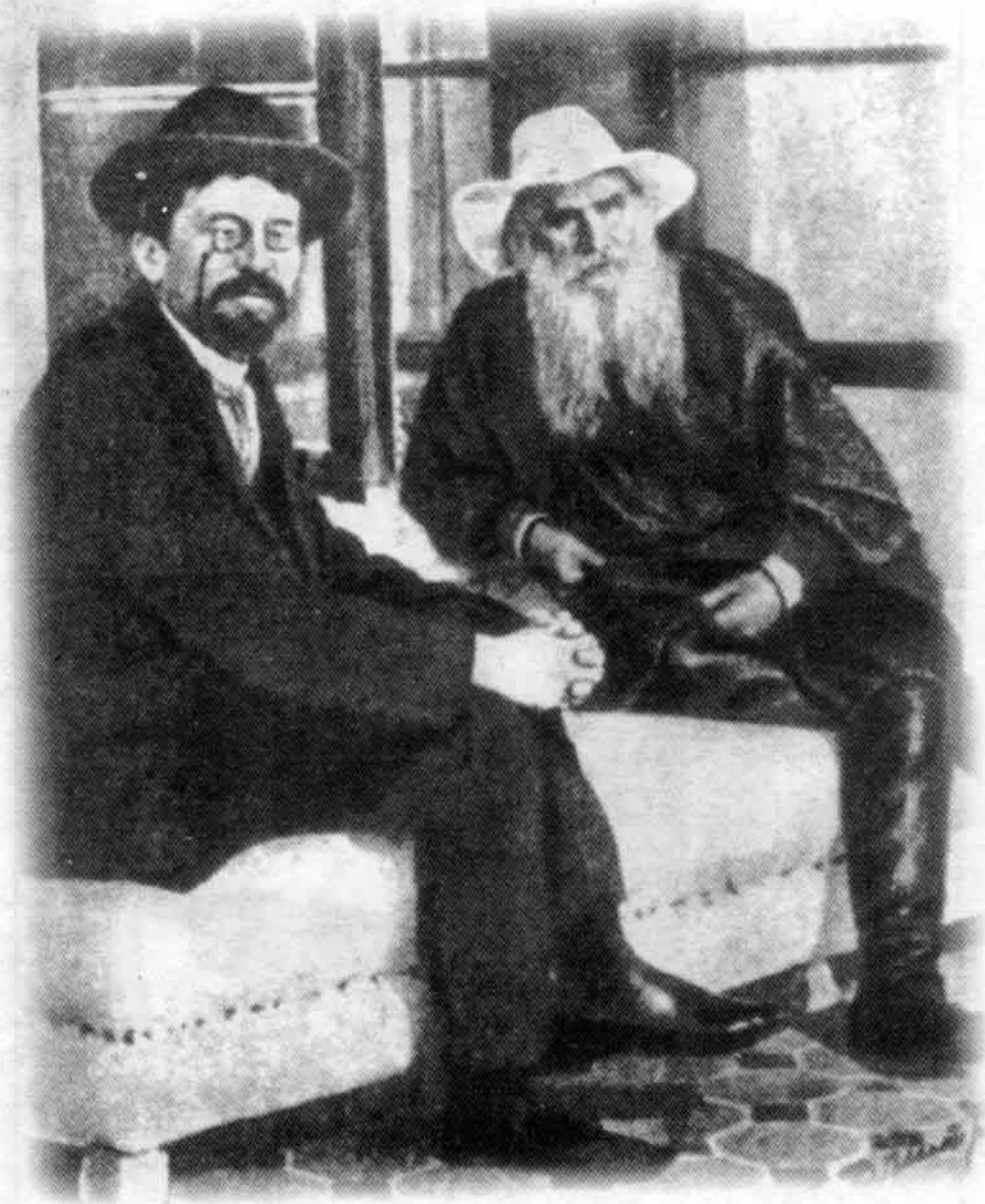
1901年，契诃夫（左）和列夫·托尔斯泰在一起