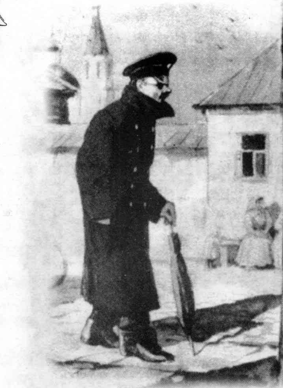
契诃夫的短篇小说《套中人》插图